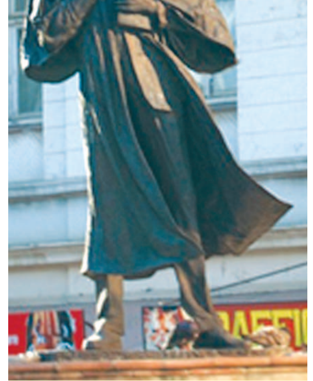
'સત્યના પ્રયોગો'માંથી સાભાર