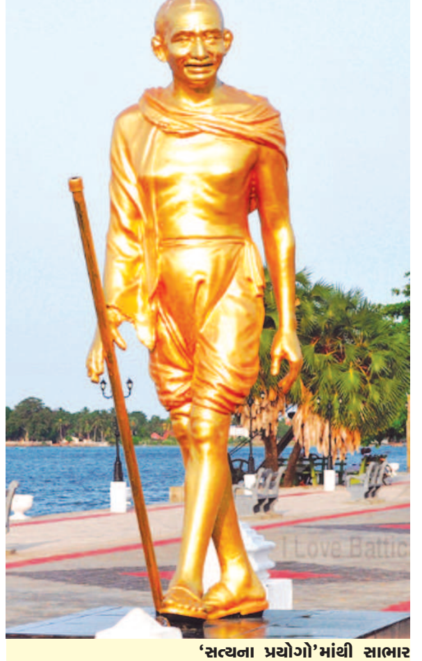
‘સત્યના પ્રયોગો’માંથી સાભાર