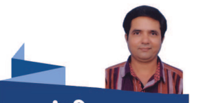
ગાંધી ૧૦૦ ડૉ. રાજેન્દ્ર જાની

મહિસાગરના કાંઠે ગાંધીજી કૂચ લઈને આવે એમ ઈચ્છતા હતા. સરદાર પટેલ મહિસાગર કાંઠાનો વિસ્તાર કહી રહ્યા હતા. તેની ઓલપાડ તાલુકાના દિહેણથી મીઠીને કરાડી, દાંડી, તિથલ અને ઉંડવાડાની યાકસાથી કરી. આ અગ્રણીઓને એમ જણાયું કે જો મહિસાગર કિનારાના બદલપુર મીઠા સત્યાગ્રહ માટે નક્કી કરવામાં આવે તો અમદાવાદથી એ માત્ર ૭૫ માઈલ જે આવેલું હોઈ બદલપુર કૂચ તા. ૧૨ થી તા. ૧૯ માર્ય માત્ર આઠ દિવસમાં પહોંચી જાય. મીઠાના સત્યાગ્રહના સચવારે સમગ્ર ભારતને લડતાના એક તાંત્રણ જોડવા માટે આઠ દિવસ ઓછા પડે એના બદલે ગાંધીજી અમદાવાદ આશ્રમથી જો સૂરતના દરિયાકાંઠા સુધી કૂચ લંબાવે તો ૭૫ માઈલના બદલે ૨૪૧ માઈલની કૂચ થાય. અને ૧૯ માર્યના બદલે છઠ્ઠી એપ્રિલ સુધી કૂચ ચલાવી શકે. જો કૂચ કદમ ગાંડી સુધી લંબાય તો યુજરાત અને ભારતમાં