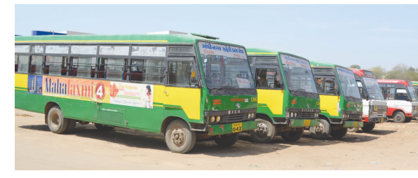
જોખમી માર્ગ સલામતી પાછળ આ કારણ પણ મુખ્ય જવાબદાર હોવાનો રોષ સ્થાનિકો ઠાલવી રહ્યા મુખ્યમાર્ગો પર વોક વેની બાજુમાં ગમે ત્યાં રીક્ષા ઉભી રહી જાય છે. આવા સંજોગોમાં અકસ્માતની

ગાંધીનગર તા. ૨૮ શહેરમાં દોડતી સીટી બસ તેમજ એસ ટી શહેરી રૂટની બસ નિયત સ્ટોપના બદલે આગળ જઈને માર્ગ વચ્ચે ઉભી કરી દેવાતી જોખમી છે. સ્ટોપ કરતા દુર બસ ઉભી રાખવામાં આવતા સિનિયર સિટીઝન્સ તેમજ મહિલાઓએ વિશેષ હાડમારી વેઠવી પડે છે. શહેરમાં જોખમી માર્ગ સલામતી વચ્ચે રીક્ષા સ્ટેન્ડ માટે જગ્યા નિયત થઈ નથી. જ્યારે શહેરના વિવિધ માર્ગો પર એસ ટી બસ સહિત સીટી બસ પણ નિયત સ્ટોપ કરતા આગળ માર્ગ વચ્ચે જ ઉભી રહેતા મુસાફરોની સલામતી સામે પણ મોટો પ્રશ્ન મંડરાયો છે. જોખમી માર્ગ સલામતી પાછળ આ કારણ પણ મુખ્ય જવાબદાર હોવાનો રોષ સ્થાનિકો ઠાલવી રહ્યા મુખ્યમાર્ગો પર વોક વેની બાજુમાં ગમે ત્યાં રીક્ષા ઉભી રહી જાય છે. આવા સંજોગોમાં અકસ્માતની