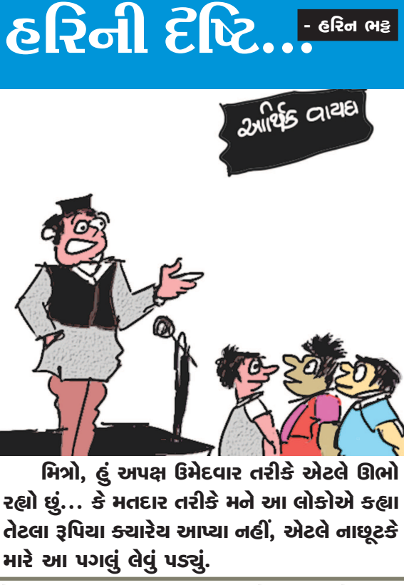
મિત્રો, હું અપદ્ધ ઉમેદવાર તરીકે એટલે ઊભો રહ્યો છું... કે મતદાર તરીકે મને આ લોકોએ કહ્યા તેટલા રૂપિયા કચારેય આપ્યા નહીં, એટલે નાણૂટકે મારે આ પગલું લેવું પડ્યું.