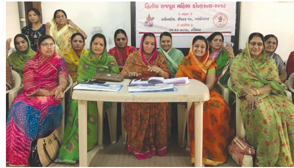
મહિલાઓ પણ સમયની સાથે સાથે કદમ મિલાવીને આગળ વધે તે માત્ર સમાજ માટે જ નહીં પરંતુ રાષ્ટ્ર માટે પણ જરૂરી બન્યું છે. આ કોન્ફરન્સનું ઉદ્દેશ્ય ત્રણ સવારે ૧૦ કલાકે રાજ્યના મુખ્યમંત્રી વિજયભાઈ રૂપાણીના હસ્તે કરવામાં આવશે. આ અંગે ગાંધીનગર રાજપૂત મહિલા આર.જી.એ.એ. જણાવ્યું કે મંડળના પ્રમુખ સુશીલાબા આર.જી.એ.એ. જણાવ્યું કે આજના સમયમાં શ્રત્રિય રાજપૂત સમાજ માટે અનેક પડકારો ઉભા છે. તેમાં પણ મહિલાઓ માટે

શ્રી કચ્છ કાઠીયાવાડ રાજપૂત સેવા સમાજ અને ગાંધીનગર રાજપૂત મહિલા મંડળ દ્વારા ગાંધીનગર ટાઉનહોલ ખાતે આગામી તા. ૩૧ માર્ચને રવિવારના રોજ દ્વિતિય રાજપૂત મહિલા કોન્ફરન્સનું આયોજન કરવામાં આવ્યું છે. આ કોન્ફરન્સમાં સમગ્ર રાજ્યમાંથી અંદાજીત ૧૫૦૦ થી વધુ રાજપૂત સમાજની મહિલાઓ હાજર રહેશે. કોન્ફરન્સમાં રાજપૂત સમાજની સંસ્કૃતિનું જતન, ઠિકરીઓને ભણાવવા તેમજ ભવિષ્યના પ્રશ્નો અને પડકાર મામલે ચર્ચા વિચારણા કરવામાં આવશે. જ્યારે આગામી લોકસભાની ચૂંટણીમાં ગુજરાતના તમામ રાજપૂત સમાજના પરિવારના સભ્યોને મતદાન કરવા માટે અખીલ કરવામાં આવી છે. કચ્છ કાઠીયાવાડ રાજપૂત સેવા સમાજ દ્વારા વર્ષ ૨૦૧૪ માં શહેરમાં પ્રથમવાર મહિલા કોન્ફરન્સ યોજાઈ હતી. જેમાં તત્કાલીન મુખ્યમંત્રી અને હાલના વડાપ્રધાન નરેન્દ્રભાઈ મોદી પણ ઉપસ્થિત રહ્યા હતા. આજના સમયમાં સમાજ ઘડતર અને રાષ્ટ્ર ઘડતરમાં મહિલાઓની પણ મુખ્ય ભૂમિકા રહેલી છે. તેમાં રાજપૂત સમાજની મહિલાઓનું પણ યોગદાન જરૂરી નહીં પરંતુ આવશ્યક છે. ત્યારે આજે સમય બદલાયો છે રાજપૂત સમાજની નોકરી વ્યવસાયથી લઈને ઠિકરીઓને ભણાવવા, બાળકોનું ઘડતર, તપસ્વીનીઓ, નિરાધાર, અશક્ત રાજપૂતાણી અને તેઓના પરિવારના પ્રશ્નો જેવા મહત્વના