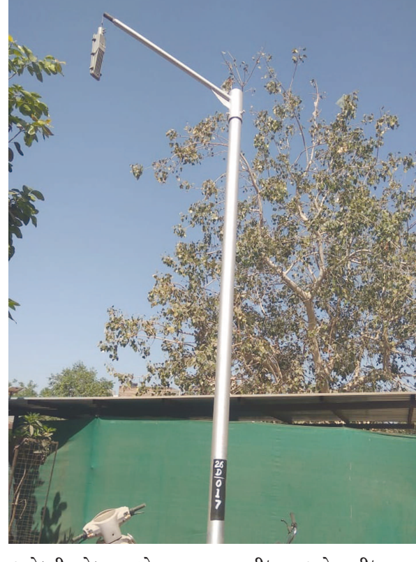
કિસાનનગર ખાતે પ્લોટ નં. ૫૫૯/૨ નજીકના વિસ્તારમાં ગાંઠિયા સમાન બનીને રહી જવા પામ્યાં છે. વીજ પોલ નં.

ગાંધીનગર, તા. ૨૮ એક તરફ શહેરમાં ચૂંટણીઓનો માહોલ ધીમે ધીમે રંગ પકડી રહ્યો છે અને નેતાઓ તથા રાજકીય અગ્રણીઓ મતદારોને અવનવા વચનો આપી રીડવા પ્રયાસ હાથ ધરી રહ્યાં છે. જ્યારે બીજી તરફ શહેરની જૂની વસાહતોમાં પણ પાયાની સુવિધાઓમાં બેદરકારીના કારણે પ્રજા તસ્ત જોવા મળી રહી છે. રાજ્યના પાટનગરમાં જ્યારે ગ્લોબલ ટ્રેડ શો કે વાઈબ્રન્ટ સમિટ હોય ત્યારે ચોતરફ રાતોરાત રંગબેરંગી રોશનીનો ઝગમગાટ બંધકી દેવામાં આવે છે પરંતુ સેક્ટર-૨ ૬ ના કિસાનનગર જ્યાં નાગરિકો વર્ષોથી રહે છે ત્યાં છેલ્લાં છ એક માસથી સ્ટ્રીટલાઈટો બંધ બાલતમાં હોવાને કારણે અસંખ્ય પરિવારો પરેશાનીનો ભોગ બની રહ્યાં છે પરંતુ તંત્રને આ સમસ્યા ઉકેલવામાં જાણે કોઈ રસ જ નથી તેવી સ્થિતિ જોવા મળી રહી છે.