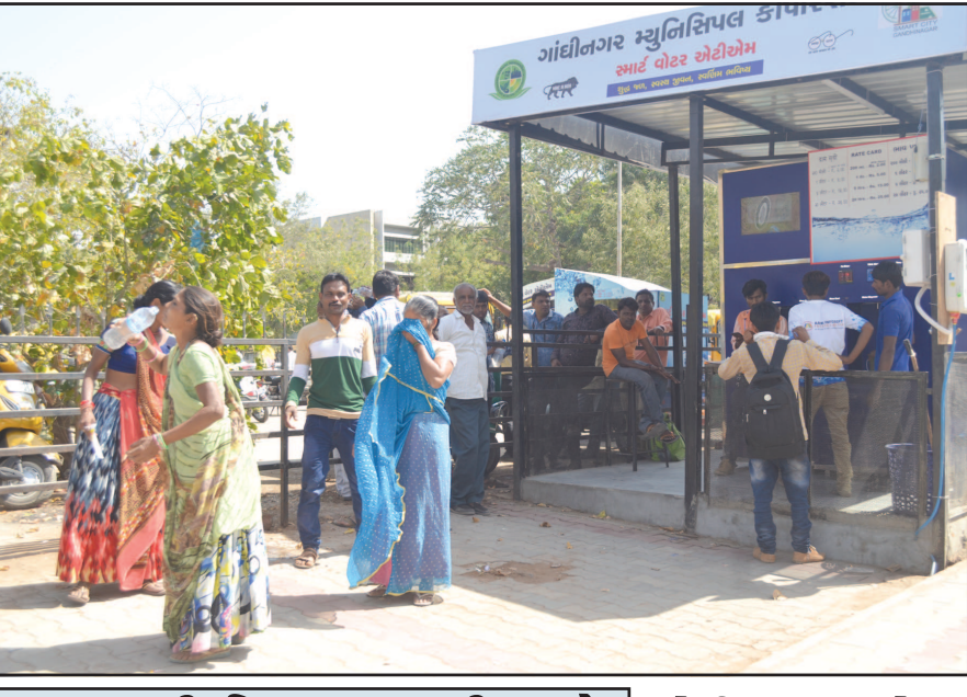
ગાંધીનગર તા ૨૯ ગાંધીનગરમાં ઉનાળાની મોસમ નિખરી રહી છે. આજે સવારથી જ ગરમીનો મિજાજ આકરો હોવાનું નગરજનોએ અનુભવ્યું હતું. ગઈકાલની સાંપેક્ષમાં આજે લઘુત્તમ અને મહત્તમ તાપમાનમાં નોંધપાત્ર ફેરફાર જોવા મળ્યો હતો ગરમીનો પારો ૪૦ ડિગ્રીને પાર પહોંચી જતા દિવસ દરમિયાન નગરજનોએ અંગ દમાડતી ગરમીનો અહેસાસ કર્યો હતો.

દિવસે અંગ દમાડતો તાપ : નગરજનો બેભાકળા : ન્યુનતમ પારો પણ ૨૫ ડિગ્રીએ : સવારથી જ ગરમીનો અહેસાસ થતા નગરજનો બપોરે ઘરમાં પુરાયા