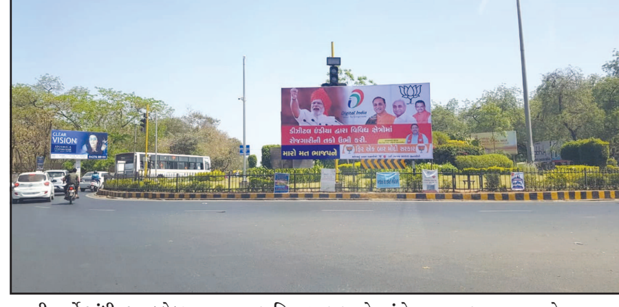
૩૦મી માર્ચે ગાંધીનગર કલેક્ટર ઓફિસમાં તેમનું ઉમેદવારી ફોર્મ ભરશે, જો કે તે પહેલાં તેઓ અમિત શાહ આજે સાંજે ૭.૩૦ કલાકે અમદાવાદ આવ્યા છે. તેમને લાલકૃષ્ણ અડવાણીની પર આવ્યા ત્યારે ૨૦૦૦ કાર્યકરોએ તેમનું ભવ્ય સ્વાગત કર્યું હતું. એરપોર્ટ થી સીધા તેઓ તેમના

ગાંધીનગર,તા. ૨૯ ભાજપના રાષ્ટ્રીય અધ્યક્ષ અમિત શાહ લોકસભાની ઉમેદવારી કરવા માટે આજે સાંજે ગુજરાત આવી ગયા છે. તેઓ અમદાવાદ થી ગાંધીનગર સુધીનો લાંબો રોડ શો કરશે જેમાં કેન્દ્રીય નેતાઓ પણ ઉપસ્થિત રહેશે. તેમનો રોડ શો ચાર કિલોમીટર લાંબો હશે.