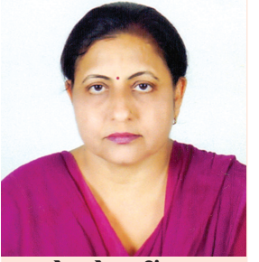
રેહુબેન ટીંગરા લાયસેન્સ કલબ