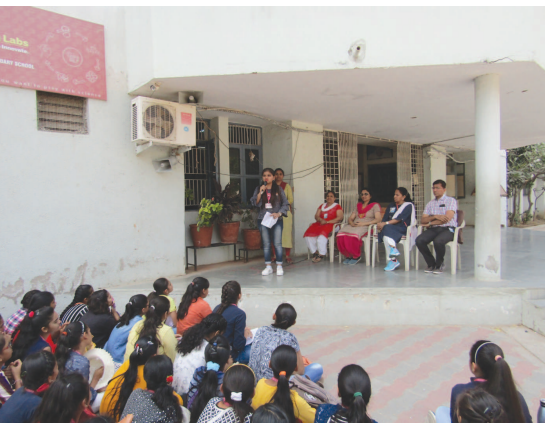
ગાંધીનગર, તા. ૯