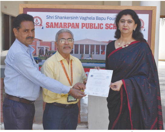
ગાંધીનગર, તા. ૯