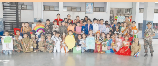
ગાંધીનગર, તા. ૯

ગાંધીનગર ઈન્ટરનેશનલ પબ્લિક સ્કૂલમાં આજે વેશભૂષા સ્પર્ધાનું આયોજન કરવામાં આવ્યું હતું. જેમાં ધોરણ ૧ થી ૪ ના નાના નાના ભૂલકઓએ ભાગ લીધેલ હતો. શાળા પરિવાર બાળકોમાં રહેલી સુષુપ્ત શક્તિઓને આવી જ વિવિધ પ્રકારની સ્પર્ધાઓ દ્વારા ખીલવવાનો પ્રયાસ કરે છે. વિદ્યાર્થીઓએ ઘણા ઊત્સાહથી આ સ્પર્ધામાં ભાગ લીધો હતો. આ સ્પર્ધામાં બાળકોએ ક્રિકેટર, ડોક્ટર, આર્મીમેન, પોલીસમેન, કમાન્ડો, શિક્ષક, પરી, રાણી લક્ષ્મીબાઈ વગેરે જેવી વેશભૂષા ધારણ કરીને તેમની ભૂમિકા ભજવી હતી. શાળાના પ્રિન્સીપાલશ્રીએ પ્રસંગોચિત ઉદબોધન કર્યું હતું.