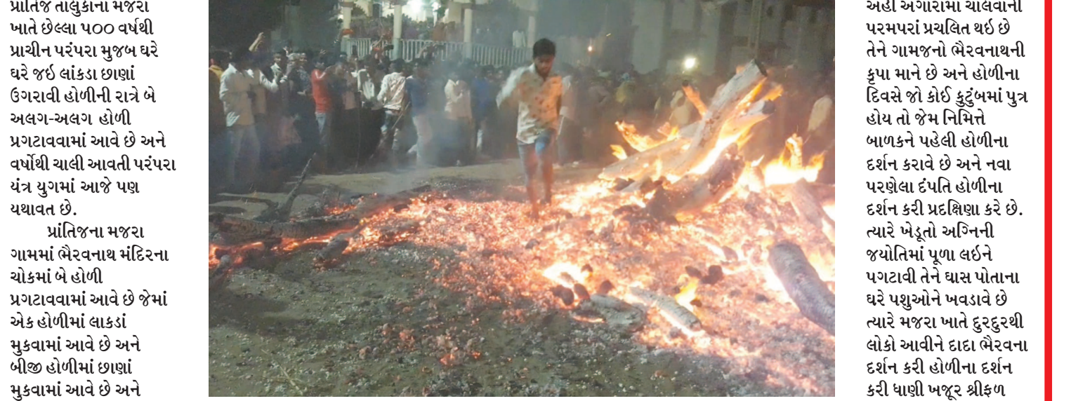
છે છતાં હજુ સુધી કોઈપણ દાઝયુ હોય તેવો કોઈ બનાવ બન્યો નથી, ત્યારે દાદા ભેરવનાથના દર્શન તથા તાલુકા સહિત મહેસાણા, અમદાવાદ, મોડાસા, પોતાની રાખેલ માનતા બાધા પૂર્ણ કરે છે. તો વર્ષોથી અંહી અંગારામાં ચાલવાની પરમપરાં પ્રચલિત થઈ છે તેને ગામજનો ભેરવનાથની કુપા માને છે અને હોળીના દિવસે જો કોઈ કુટુંબમાં પુત્ર હોય તો જેમ નિમિત્તે બાળકને પહેલી હોળીના દર્શન કરાવે છે અને નવા પરણેલા દંપતિ હોળીના દર્શન કરી પ્રદક્ષિણા કરે છે. ત્યારે ખેડૂતો અગ્નિની જ્યોતિમાં પૂળા લઈને પગટાવી તેને ઘાસ પોતાના ઘરે પશુઓને ખવડાવે છે ત્યારે મજરા ખાતે દુરદુરથી લોકો આવીને દાદા ભેરવના દર્શન કરી હોળીના દર્શન કરી ધાણી ખજૂર શ્રીકૃષ્ણ શેરડી કેરી ચણાવીને પૂજા કરી ધન્યતા અનુભવે છે.

પ્રાંતિજ, તા. ૧૧ સાબરકાંઠા જિલ્લાના પ્રાંતિજ તાલુકાના મજરા ખાતે છેલ્લા ૫૦૦ વર્ષથી પ્રાચીન પરંપરા મુજબ ઘરે ઘરે જઈ લાંકડા છાણાં ઉગરાવી હોળીની રાત્રે બે અલગ-અલગ હોળી પ્રગટાવવામાં આવે છે અને વર્ષોથી ચાલી આવતી પરંપરા યંત્ર યુગમાં આજે પણ યથાવત છે.