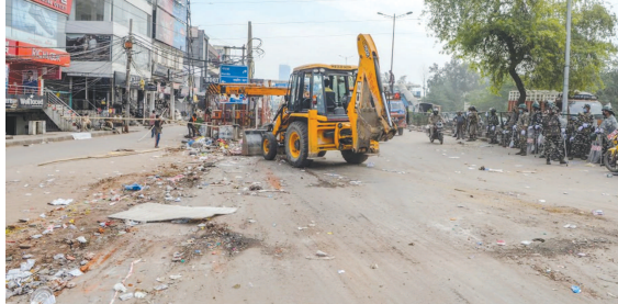
ડિસેમ્બરથી દિલ્હીના શાહીબાગ વિસ્તારમાં ધરણા પર બેઠેલા દેખાવકારોને પોલીસે કફર્યૂને પગલે ખસડી દીધા છે. મંગળવારે ખસેડી લીધા છે. કોરોના વાયરસની મહામારી વચ્ચે પણ આ લોકો ધરણા પર બેઠા હતા. કોરોનાને પગલે દિલ્હી સહિત

૩ મહિનાથી ચાલી રહેલા સીએએ વિરોધી પ્રદર્શનના ટેન્ટ ઉખાડ્યા ન્યુ દિલ્હી, તા. ૨૪ સવારે દિલ્હી અને નોઈડાને નાગરિકતા સંશોધન કાયદા (સીએએ) વિરુદ્ધ ૧૫ સમગ્ર ભારત લોકડાઉન થઈ ગયું છે. તેમ છતાં મંગળવારે મહિલાઓ ફરી એકત્ર થવા લાગી હતી. પોલીસે જણાવ્યું કે દેખાવકારોને હટાવીને ત્યાંથી ટેન્ટના દબાણો દૂર કરી દેવાયા છે. કેટલાક લોકોની અટકાયત પણ કરવામાં આવી છે. શાહિબાગ વિસ્તારમાં છેલ્લા ૧૦૦ દિવસથી કેટલીક મહિલાઓ વિરોધ પ્રદર્શન કરી રહી હતી. મંગળવારે સવારના જ મહિલાઓ ફરી શાહીબાગ વિરોધ સ્થળ પર એકત્ર થવા લાગી હતી. હાલમાં મોટાપાયે પોલીસ ફોર્સ ખસડી દેવામાં આવી છે. કોરોના વાયરસની મહામારી વચ્ચે પણ આ લોકો ધરણા પર બેઠા હતા. કોરોનાને પગલે દિલ્હી સહિત