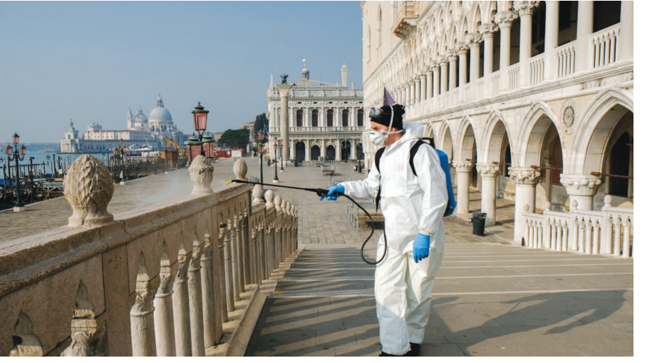
મોતનો આંકડો ચિંતાજનક રીતે વધી રહ્યો છે. ચીનમાં સ્થિતિ ધીમે ધીમે કાબુમાં આવી રહી છે. પરંતુ અંકુશ મુકવામાં હવે સફળતા મળી રહી છે. જે ત્યાંના લોકો માટે

મોતનો આંકડો ઝડપથી વધીને ૧૬૫૫૮ થયો : સ્થિતિ હજુ બેકાબુ : વિશ્વભરના દેશો કોરોનાને રોકવામાં હજુ સફળતા મેળવી શક્યા નથી : દરરોજ હજારોની સંખ્યામાં કેસ સપાટી પર બેલ્જિમ, તા. ૨૪ કોરોના વાયરસના કારણે દુનિયાના દેશોમાં ભારે હાહાકારની સ્થિતિ યથાવત રીતે રહેલી છે. તબીબી ક્ષેત્રમાં શ્રેષ્ઠ સુવિધા ધરાવતા ઈટાલી સહિતના દેશો કોરોનાના કારણે હાથ ઉઠાવી શકી ચુક્યા છે. કેસોની સંખ્યામાં સતત વધારો થઈ રહ્યો છે. આજે કોરોનાના કારણે પ્રભાવિત રહેલા વિશ્વના ૧૯૫ દેશોમાં મોતનો આંકડો વધીને ૧૬૫૫૮ સુધી પહોંચી ગયો હતો. જ્યારે કેસોની સંખ્યા ૫૦૮ થઈ ગઈ છે. રિકવર થયેલા લોકોની સંખ્યા ૧૦૨૪૨૯ સુધી પહોંચી ગઈ છે. આવી જ રીતે વિશ્વના ૧૯૫ દેશોમાં ગંભીર રીતે અસરગ્રસ્ત રહેલા દર્દીઓની સંખ્યા ૧૨૦૬૨ સુધી રહેલી છે. જે સાબિત કરે છે કે મોતનો આંકડો હજુ ખુબ ઉપર પહોંચનાર છે. ગયા વર્ષે ડિસેમ્બર મહિનામાં કોરોના વાયરસની શરૂઆત ચીનમાં થયા બાદથી એક પછી એક કરતા વધુ ૧૯૫ દેશો કોરોના વાયરસના સંક્રમણમાં આવી ગયા છે. હોંગકોંગ, દક્ષિણ કોરિયા, થાઈલેન્ડ, અમેરિકા, તાઈવાન, મલેશિયા અને જર્મની સહિતના દેશો વાયરસના સંક્રમણમાં આવી ગયા છે. કેસોની સંખ્યા ચિંતાજનક રીતે વધી રહી છે. દરરોજ કેસોની સંખ્યામાં ચિંતાજનકરીતે વધારો થઈ રહ્યો છે. ગંભીર રીતે બિમારીના સંક્રમણમાં રહેલા લોકોની સંખ્યા હજારોમાં છે. જે કુલ કેસોના ૨૧ ટકા જેટલી છે. વાયરસને કાબુમાં લેવા માટે વિવિધ પગલા લેવામાં આવી રહ્યા હોવા છતાં રોગ પર કાબુ લેવામાં સફળતા હાથ લાગી રહી નથી. ભારે હાહાકાર જારી છે.