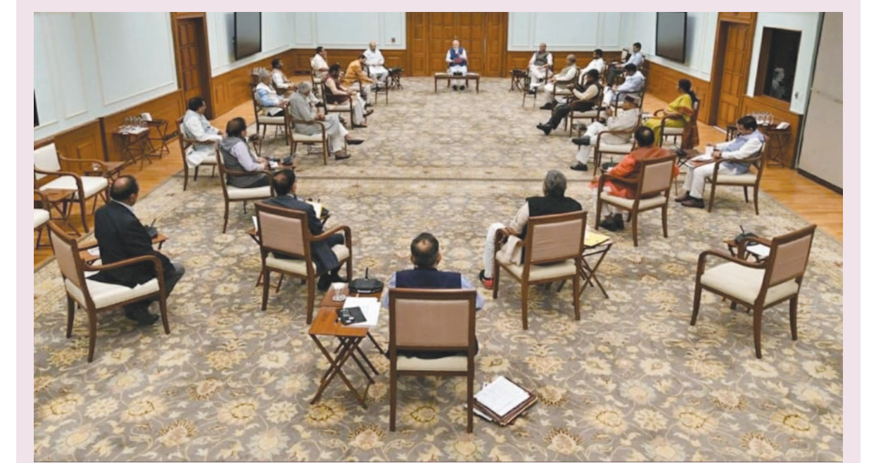
સોશયલ ડિસ્ટન્સનું અનોખું દૃષ્ટાંત - કેન્દ્રીય ડેબીનેટની પ્રધાનમંત્રીના અધ્યક્ષ સ્થાને મળેલી મહત્વની બેઠકમાં સોશયલ ડિસ્ટન્સને પ્રાધાન્ય અપાયું હતું... દરેક મંત્રીઓની ખુરશીઓની વચ્ચે ૧ મીટરનું અંતર રખાયું હતું... આ અનોખું દૃશ્ય સમગ્ર દેશ માટે દૃષ્ટાંત રૂપ છે. તસવીર સંદેશ આપે છે કે, કોઈને પણ મળીએ તો સલામત અંતરે મળીએ... આજના સંજોગોમાં સોશયલ ડિસ્ટન્સ અનિવાર્ય છે...

નવી દિલ્હી, તા. ૨૫ ખતરનાક કોરોના વાયરસના સર્કલમાં દુનિયાના દેશોની સાથે સાથે બ્રિટન પણ આવી ચુક્યું છે. બ્રિટનના પ્રિન્સ ચાર્લ્સ કોરોના વાયરસ માટે પોઝિટિવ આવ્યા છે. તેઓ પહેલાથી જ સ્કોટલેન્ડમાં આઈસોલેશનમાં છે જ્યારે તેમના પત્નિ કેમિલા નેગેટિવ આવ્યા છે. થોડાક દિવસ પહેલા જ ચાર્લ્સની મુલાકાત મોનેકોના પ્રિન્સ એલ્બર્ટ સાથે થઈ હતી જે મોરેથી કોરોના પોઝિટિવ આવ્યા હતા. બ્રિટનમાં કોરોના વાયરસના પરિણામે ૪૨૨ લોકોના મોત થઈ ચુક્યા છે જ્યારે ૮૦૭૭ લોકો તેના સર્કલમાં આવ્યા છે. કલેરેન્સ હાઉસના પ્રવક્તાએ કહ્યું છે કે, પ્રિન્સ ઓફ વેલ્સને કોરોના વાયરસ માટે પોઝિટિવ દર્શાવવામાં આવ્યા છે. તેમની બિમારીના લક્ષણ દેખાયા હતા પરંતુ શરૂઆતમાં ધ્યાન અપાયું ન હતું. જો તેઓ હવે સ્વસ્થ છે. તેઓ હાલમાં ઘરથી જ કામ કરી રહ્યા છે. દરેક ઓફ કોર્નેલોના પણ ટેસ્ટ કરવામાં આવ્યા છે પરંતુ તેમાં કોરોનાના કોઈ લક્ષણ આવ્યા નથી. સરકારી અને મેડિકલ સલાહના આધાર પર પ્રિન્સ હાલમાં બાલમોરલ