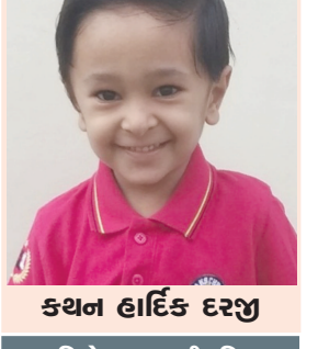
કથન હાર્દિક દરજુ

જન્મદિને વધામણી વિભાગ અંતર્ગત કોઈપણ વાચક પોતાની તસવીર પ્રકાશન માટે મોકલી શકે છે. પરંતુ, વાચકને વિનંતી છે કે મોકામાં મોકી આ તસવીરો જન્મદિવસ હોય તેના અગાઉના દિવસે એક વાગ્યા સુધીમાં અપાવવાને મળી જાય. વાચકો ઈચ્છે તો આ વિભાગમાં પ્રકાશન હેતુ પોતાની તસવીર અગાઉથી પણ મોકલાવી શકે છે. - સંપાદક