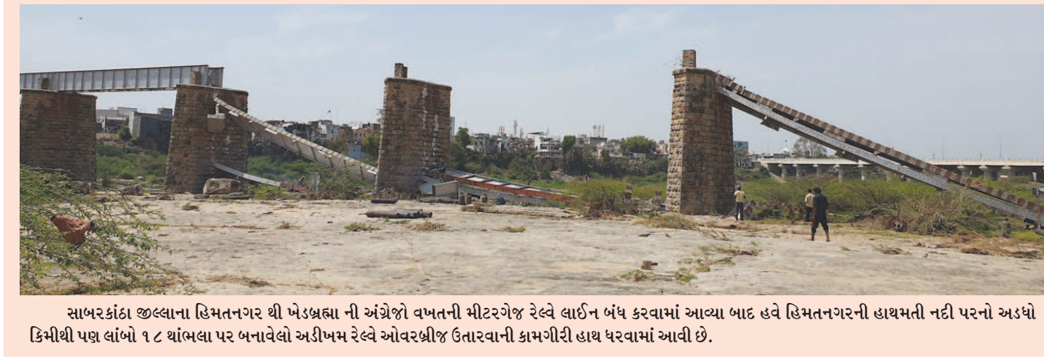
સાબરકાંઠા જિલ્લાના હિમતનગર થી ખેડબ્રહ્મા ની અંગ્રેજો વખતની મીટરગેજ રેલ્વે લાઈન બંધ કરવામાં આવ્યા બાદ હવે હિમતનગરની હાથમતી નદી પરનો અડધો કિમીથી પણ લાંબો ૧૮ થાંભલા પર બનાવેલો અડીખમ રેલ્વે ઓવરબ્રીજ ઉતારવાની કામગીરી હાથ ધરવામાં આવી છે.

વડોદરા પોઝિટિવ કેસ સામે આવ્યા છે. આ સાથે રાજ્યમાં કોરોના પોઝિટિવના કુલ કેસો ૪૪ થયા છે. બીજાબાજુ, સુરત બાદ હવે અમદાવાદ અને ભાવનગરમાં કોરોના વાયરસના કારણે એક-એક વ્યક્તિના મોત નોંધાતાં સમગ્ર રાજ્યમાં ભારે ચક્રચાર મચી ગઈ છે. આ સાથે ગુજરાતમાં કોરોના વાયરસના કારણે કુલ ત્રણના મોત નોંધાયા છે. કોરોનાના કારણે એક પછી એક પોઝિટિવ કેસોની સંખ્યા વધતાં અને હવે મૃત્યુઆંક પણ વધવાની શરૂઆત થતાં સરકાર અને તંત્ર દોડતુ થઈ ગયું છે.