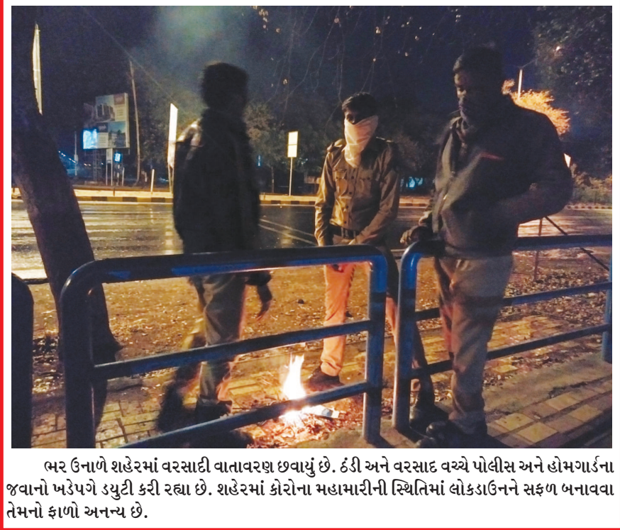
ભર ઉનાળે શહેરમાં વરસાદી વાતાવરણ છવાયું છે. ઠંડી અને વરસાદ વચ્ચે પોલીસ અને હોમગાર્ડના જવાનો ખડેપગે ડયુટી કરી રહ્યા છે. શહેરમાં કોરોના મહામારીની સ્થિતિમાં લોકડાઉનને સફળ બનાવવા તેમનો ફાળો અનન્ય છે.

ગાંધીનગર શહેર પ્રકૃતિની વચ્ચે વસેલું છે. અનેક વૃક્ષો અને વનરાજીથી ઘેરાયેલા આ શહેરમાં હજુ વાંદરા, નીલગાય અને હરણ જેવા પ્રાણીઓની અવરજવર જોવા મળે છે. જો કે છેલ્લા કેટલાક વર્ષોમાં વાહનોની અવરજવર વધતા પ્રાણીઓની ગતિવિધિ શહેરમાં ઓછી થઈ ગઈ હતી. વાહનોની સતત અવરજવર તેઓને પરેશાન કરતી હતી પરંતુ લોકડાઉનના પગલે આખા શહેરમાં અજબ શાંતિ પથરાઈ ગઈ છે. કયાંય ઘોંઘાટ જોવા મળતો નથી. આ નિરવ શાંતિ વચ્ચે પ્રાણીઓ અને પંખીઓ આરામથી વિહાર કરતા નજરે પડી રહ્યા છે.