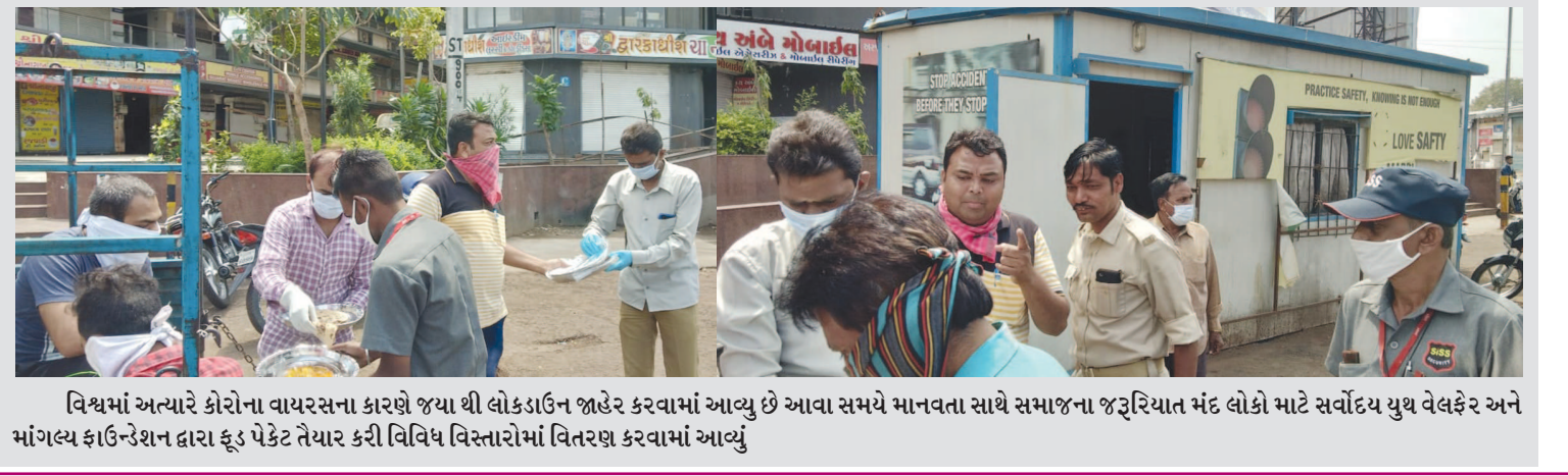
વિશ્વમાં અત્યારે કોરોના વાયરસના કારણે જયાથી લોકડાઉન જાહેર કરવામાં આવ્યું છે આવા સમયે માનવતા સાથે સમાજના જરૂરિયાત મંદ લોકો માટે સર્વોદય યુથ વેલફેર અને માંગલ્ય કાઉન્સેલ દ્વારા ફૂડ પેકેટ તૈયાર કરી વિવિધ વિસ્તારોમાં વિતરણ કરવામાં આવ્યું