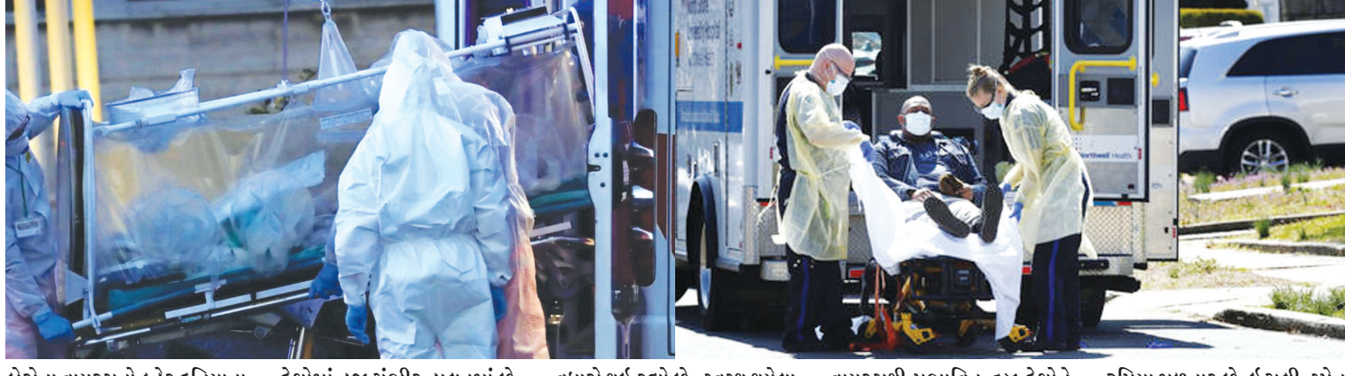
કોરોના વાયરસનો કહેર દુનિયાના ૧૯૯ દેશોમાં જારી છે. આના કારણે હજુ સુધી ૨૭૩૬૫

કોરોના સામે લડવા અમેરિકાની ભારતને ૨૯ લાખ ડોલરની સહાય વોશિંગ્ટન, તા. ૨૮ કોરોના વાયરસ સામેની લડાઈ: અમેરિકાએ ભારત માટે ૨૯ લાખ ડોલરની નાણાકીય સહાય જાહેર કરી. અન્ય દેશોને ૧૭ કરોડ ૪૦ ડોલરની સહાયતા કરશે. ભયાનક કોરોના વાયરસ સામે લડવા માટે અમેરિકાએ દુનિયાના ઘણા દેશોને પોતાના તરફથી નાણાકીય સહાય જાહેર કરી છે. ભારતને એ ૨૯ લાખ ડોલરની સહાય કરશે. કુલ ૬૪ દેશો માટે અમેરિકાએ ૧૭ કરોડ ૪૦ લાખ ડોલરની સહાયતા જાહેર કરી છે. અમેરિકાએ ગયા ફેબ્રુઆરીએ જાહેર કરેલી ૧૦ કરોડ ડોલરની સહાયતાની ઉપરાંતની આ સહાયતા છે. જે દેશો કોરોના વાયરસ રોગચાળાના સૌથી વધારે જોખમમાં મુકાઈ ગયા છે ખાસ એમને માટે આ ભંડોળ છે.