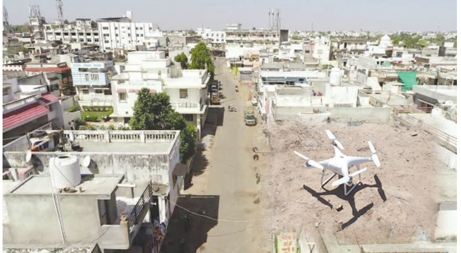
સાબરકાંઠા પોલીસે લોકડાઉનના પાંચમાં દિવસે રવિવારે હિંમતનગરમાં એસએચ અને હિંમતનગર બી ડીવીઝન પોલીસે લોકડાઉનનો વધુ કડક અમલ કરાવવા માટે વિસ્તારમાં ડ્રોન ઉડાડ્યું હતું જેને લઈને શેરી મહોલ્લામાં જે લોકો બહાર બેસી રહે છે તેને અટકાવવા માટે સફળતા પોલીસને મળી હતી.