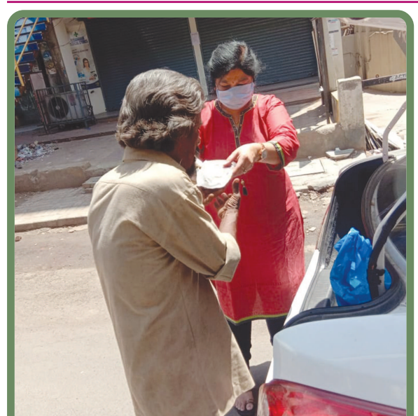
જાણીતા સંસ્થાના માલિક પ્રતિભા બેન આવેલ મુશ્કેલીઓમાં ગરીબો માટે ભોજન બનાવીને જાતે ગાડી લઈને નીકળી પડયા હતા. ‘સેવા પરમો ધરમ...’ સમજી દરેક લોકો આગલ આવે તે જરૂરી છે. કોરોના હરાવવા ભૂખથી ના મરી જાય માટે હરકોઈ આગળ આવો...