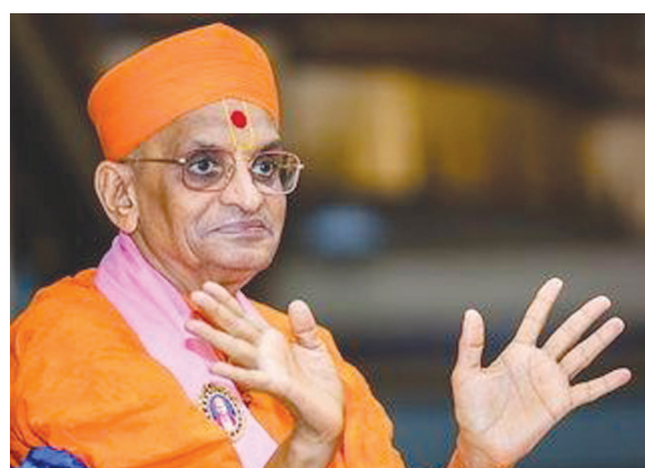
ગાંધીનગર, તા. ૨૯ આજે ભાગ્યશાળી ભારત દેશ તથા સમગ્ર વિશ્વમાં કોરોના (કોવિડ-૧૯) નું ખોફનાક તથા ભયજનક વાતાવરણ છે. અમારા સમગ્ર નાના-મોટા સર્વ ભારતીય નાગરિકોને નમ્ર વિનંતી છે કે અફવાઓ થી દુર રહી અને ભારતના

વડાપ્રધાનની અપીલ, ઉચ્ચ સરકારો તથા તજજ્ઞો, ડોક્ટરો તથા અન્ય સરકારી અધિકારો જે જે પ્રમાણે સુચના આપે એ પ્રમાણે આપણે ગંભીરતાપૂર્વક પાલન કરીએ અને કોરોના મહામારીને હરાવવામાં આપણે સહુ સાથ, સહકાર, સહયોગ આપીએ. શ્રી સ્વામિનારાયણ ગાદી સંસ્થાના તરફથી સમગ્ર ભારત દેશ તથા સર્વ વિશ્વનું મંગલ થાય તેવી મનોકામના છે તથા સોશિયલ ડિસ્ટન્સ રાખવું જેથી બહુ જલ્દી થી સ્વાસ્થ્ય સંપાદન કરીએ એવી પૂર્ણ પુરુષોત્તમ શ્રી સ્વામિનારાયણ ભગવાનના ચરણોમાં પ્રેમ આદર સહિત પ્રાર્થના કરીએ છીએ.