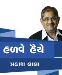
હળવે હેવે પ્રકાશ લાલા