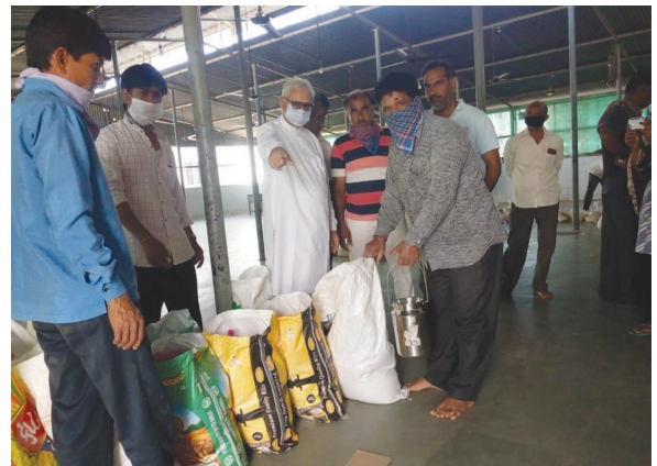
ચિલોડા, તા. ૨૯ કોરોના વાઈરસ મહામારીને લીધે લોકડાઉન પરિસ્થિતિમાં ગુજરાત વિદ્યાપીઠ સંચાલિત મહાદેવ દેસાઈ ગ્રામ સેવા સંકુલ - સાદરામાં ઉપ શ્રમયોગી સેવકોને બે