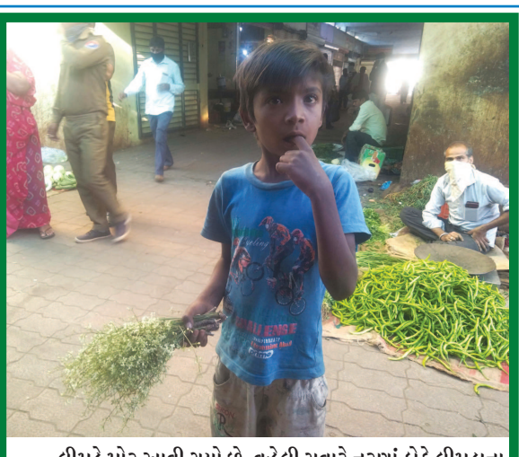
લીમડે મોર આવી ગયો છે. વહેલી સવારે નરણાં કોટે લીમડાના મોરનો રસ પીવો ખૂબ ગુણકારી ગણાય છે. લોકડાઉન વચ્ચે પણ શાકમાર્કેટમાં લીમડાનો મોર વેચાઈ રહ્યો છે.

ગાંધીનગર, તા. ૩૦ વિશ્વભરમાં કોરોના વાયરસે હાહાકાર મચાવ્યો છે. વિશ્વના અનેક દેશોના ૬૫ હજારની નાગરિકો કોરોના વાયરસથી પ્રભાવિત થયા છે. ત્યારે આ વાયરસે ભારતમાં પણ ધીમીગતિએ પગપેસારો કરી દીધો છે. ભારતમાં ૧૧૦૦ થી વધુ કેસ સામે આવ્યા છે ત્યારે ગુજરાતમાં પણ ૬૯ કેસ કોરોનાના નોંધાયા છે ત્યારે ભારતભરમાં લોકડાઉનની સ્થિતિ વચ્ચે પણ સ્થાનિક વહીવટી તંત્ર, આરોગ્ય તંત્ર અને પોલીસ તંત્ર રાત-દિવસ જોયા વિના પોતાની ફરજ જીવના જોખમે બચાવી રહ્યા છે ત્યારે રાજ્યના પાટનગરમાં પણ કોરોના ૯ કેસ નોંધાયા છે. શહેરના દુબઈથી પરત ફરેલા એક યુવકના કારણે કોરોનાનો ફેલાવો થયો છે. તે યુવક અમદાવાદ સિવિલમાં સારવાર લઈ રહ્યો છે. જ્યારે અન્ય તેના પરિચિત ૬ સભ્યો આઈસોલેશન વોર્ડમાં સારવાર હેઠળ છે. ત્યારે સિવિલના અંતરંગ સુગ્રો દ્વારા મળતી માહિતી મુજબ ગાંધીનગર સિવિલમાં સારવાર લઈ રહેલા કોરોનાના દર્દીઓ સિવિલને માથે લઈ રહ્યા હોવાનું સુગ્રો દ્વારા જાણવા મળી રહ્યું છે. આવી કપરી પરિસ્થિતિ વચ્ચે આરોગ્ય કર્મચારીઓ કામગીરી કરી રહ્યા છે. ત્યારે સિવિલની કામગીરીમાં ઉણપો કાઢવામાં આવી રહી છે. જેમાં વોર્ડમાં દિવાલ પરની ટાઈલ્સ પણ યોગ્ય લગાવી નથી, ઉખડી ગયેલી છે, બેડની ચાદરો સમયાંતરે બદલાતી હોવા છતા તેમાં પણ એક કલાકે બદલી નાંખવામાં આવે તેવી માંગ કરવામાં આવી રહી છે. ખાનગી હોસ્પિટલમાં જે પ્રકારની સારવાર અને સુવિધા આપવામાં આવે છે તે પ્રકારની માંગ કરવામાં આવી રહી છે. જેને પગલે સિવિલના કર્મચારીઓ પણ કંટાળી ગયા છે. શહેરના એક નેતા દ્વારા તેમનું ખાસ ધ્યાન રાખાવમાં આવી રહ્યું છે. તેઓ સિવિલ તંત્રને દિવસમાં બે ત્રણ વાર ફોન કરી જરૂરી કેટલીક સુચનાઓ આપતા હોય છે તેવું પણ સિવિલ તંત્રમાં ચર્ચાઈ રહ્યું છે.