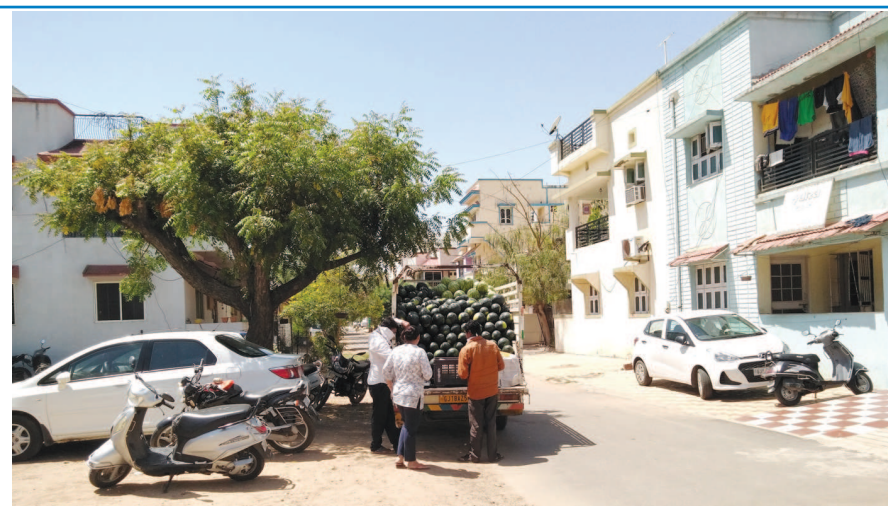
લોકડાઉનના પગલે ફળો અને શાકભાજીનું વિતરણ સાવ ઓછું થઈ ગયું છે. નાના વેપારીઓ અને ફેરીયાઓને શાકભાજી અને ફળો વેચવા ખૂબ તકલીફ પડી રહી છે. જો કે હાલમાં તડબૂચનું વેચાણ કરતાં વેપારી સેક્ટરે સેક્ટરે ફરી રહ્યાં છે.