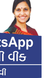
WhatsApp ઓફ ઈ વીસ નેહલ ગઢવી

આપણી આસપાસ રહેલી સ્ત્રીઓ અને તેમની માનસિકતામાં જેમ ફેરફાર થયો છે તેમ જ સમાજનો પણ સ્ત્રી પ્રત્યેનો દૈનિકોણ બદલાયો જ છે. વર્ષો સુધી સ્ત્રી એટલે સહન ઝળકતો રહ્યો. પ્રશંસાની વાત તો દૂર રહી; તેના આ કામની નોંધ પણ ભાગ્યે જ લેવાતી. પણ હવે સમય બદલાયો અને સમાજે, દુનિયાએ તેમ જ સ્ત્રીએ પોતે જાતે જ પોતાની ક્ષમતાઓની નોંધ લીધી. પણ 'અતિ સર્વત્ર વર્જયતે' અનુસાર આ અતિરેકના જુવાળે સ્ત્રીના સ્ત્રીત્વને તેમજ તેના મૂળભૂત સ્વભાવને હચમચાવી મૂક્યું છે. જેકે ૩૨ નં. સ્કોટ લખે છે : પ્રશંસાના બે બોલ આપણી વાતચીતમાં સોનાની મહોર જેટલા મૂલ્યવાન નીવડતા હોય છે. પ્રશંસા કરનાર અને તે મેળવનાર, બંનેની