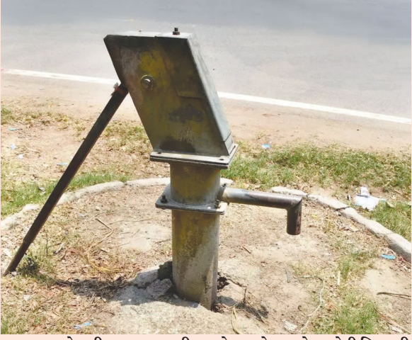
અનુકુળ ન હોવાથી નળ દ્વારા પાણી પહોંચાડવું મુશ્કેલ બન્યું છે. બંને જિલ્લાના વિકસિત ગામડાઓમાં

બાયડ (બ્યુરો ઓફિસ) તા. ૧૩ સાબરકાંઠા, અરવલ્લી જિલ્લાના વિકસિત ગામોમાં નલ સે જલ યોજના ભલે સફળ રહી હોય પરંતુ અંતરીયાળ આદિવાસી વિસ્તારોમાં આ યોજના વિક્ષણ સાબિત થઈ છે. ડુંગરાળ વિસ્તારોમાં ઘૂટા છવાયા મકાનોમાં પાઈપલાઈન નાખી નળથી પાણી પહોંચાડવામાં નેવાંના પાણી મોભે ચઢાવવા જેવો ઘાટ થયો છે. જંગલ વિસ્તારના ગામડાઓમાં હાલ પણ હેન્ડપંપ એકમાત્ર પીવાના પાણીનો વિકલ્પ બની રહ્યા છે. જિલ્લાના વિજયનગર, પોશીના, ખેરોજ, ખેડબ્રહ્મા, ભિલોડા, મેઘરજ સહિતના આદિવાસી વિસ્તારોમાં ઘૂટી છવાયો વસવાટ કરતા હજારો પરિવારો માટે નલ સે જલ યોજના ઝાંઝવાના જળ જેવી સાબિત થઈ છે. રાજ્ય સરકાર દ્વારા પ્રત્યેક નાગરિકને નળ દ્વારા પીવાનું શુદ્ધ પાણી મળી રહે તેવા પ્રયાસ થઈ રહ્યા છે. પરંતુ અંતરીયાળ ગામડાઓમાં ભૌગોલિક સ્થિતિ વહીવટી તંત્ર તેમજ ગ્રામ પંચાયતોના પ્રયાસોથી નલ સે જલ યોજનાને સફળ બનાવવા માટે પ્રયાસ થયા છે જેમાં નળના