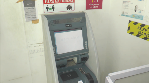
બનાવો બન્યા છે અને દ્વાર પાર વિનાના એટીએમ ઉપર લાગેલા સીસી કેમેરા તોડી કે કલર નો સ્પે મારી એટીએમ તોડીને ચોરી ના કિસ્સાઓ પ્રકાશ મા આવ્યા છે

પ્રાંતિજ તા. ૧૩ સાબરકાંઠા જિલ્લાના પ્રાંતિજ ખાતે પ્રાંતિજ પોલીસ દ્વારા પ્રાંતિજ ખાતે આવેલ દ્વાર પાર વિનાના એટીએમો ઉપર દ્વાર પાર રાખવામા આવે તે માટે બેંકોને લેખિતમાં જાણ કરી.