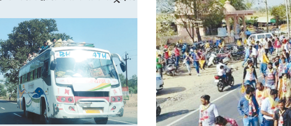
ગમખવાર અકસ્માતની ભીંતી છતાં પોલીસ-આર.ટી.ઓ.ના આંખ આડાકાન

અરવલ્લી જિલ્લામાં આર.ટી.ઓ. કચેરીની પોલિસપોલ બહાર આવી છે. આ માત્ર કચેરીની અંદરની વિગતો છે પરંતુ બહારની વિગતો બહુ ચોક્કાવતી છે. જિલ્લાના તમામ શહેરી અને ગ્રામ્ય રૂટ ઉપર ખાખી વર્દીના ૨૨ વગર ઘેટાં-બકરાંની માફક મુસાફરો ભરીને વાહનો દોડી રહ્યા છે તેમાંય ડોળી-યુગીટોનું પરનજીક આવતાં વાહનમાં ડોળી-બમ્પ સામે ડોળી-મુસાફરો ભરીને સેમી લકઝરીઓ દોડી રહી છે. ગમખવાર અકસ્માતની ભીંતી છતાં પોલીસ-આર.ટી.ઓ.ના આંખ આડા કાન નજર અંદાજ ન કરી શકાય. રીક્ષાચલકને કનડગત કરતી ખાખી વર્દીને એવો તે કયો પ્રેમ ઉભરાયો કે અન્ય મોટાં વાહનોમાં ભ્રમતા કરતાં વધુ મુસાફરો હોવા છતાં ઈતિહાસી કાર્યવાહી થતી નથી. જિલ્લા પોલીસ વડા સંજય ખરાત દ્વારા તપાસ થાય તો ટૂંકીક