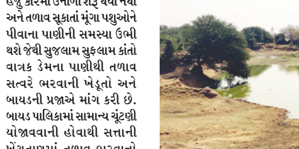
રામના તળાવમાં ચોમાસા દરમ્યાન સારા વરસાદથી તળાવ છલકાતાં ખેડૂતો મલકાયા હતા. બોરકૂવા રીચાર્જ આ વર્ષે જાન્યુઆરીના આરંભે જ તળાવ, ચેકડેમ સૂકાતાં ખાલીખમ તળાવો ભરવા માટે સરકાર અને વિભાગમાં

બાયડ (બ્યુરો ઓફિસ) તા. ૧૪ બાયડમાં રામનું તળાવ સૂકાતાં ચિંતાનાં વાદળ ઘેરાયાં છે. હજુ કારમો ઉનાળો શરૂ થયો નથી અને તળાવ સૂકાતાં મૂંઝા પશુઓને પીવાના પાણીની સમસ્યા ઉભી થશે જેથી સુજલામ સુકલામ કાંતો વાત્રક ડેમના પાણીથી તળાવ સત્વરે ભરવાની ખેડૂતો અને બાયડની પ્રજાએ માંગ કરી છે. બાયડ પાલિકામાં સામાન્ય ચૂંટણી યોજાવવાની હોવાથી સત્તાની ખેંચતાણમાં તળાવ ભરવાનો મુખ્ય મુદ્દો ભૂલાયો છે. રામનું તળાવ સૂકાતાં આસપાસના બોરકૂવામાં પાણીનાં તળ વધુ ઉંડાં ઉતર્યા છે.