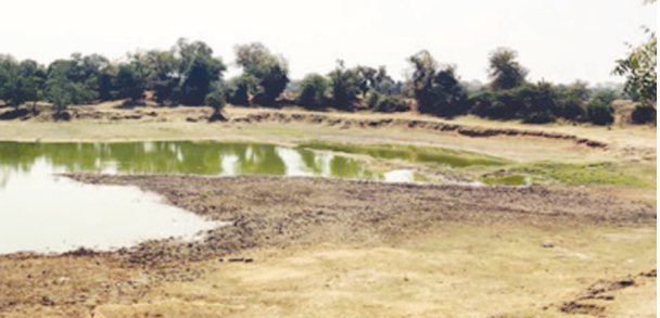
વિટંબણને બંને મુખ્ય રાજકીય પક્ષો ભાજપ અને કોંગ્રેસના આગેવાનોએ નજર અંદાજ કરી જેનું પરિણામ નજર સમજ છે. અંદાજીત ૨૫ વિદ્યામાં પથરાયેલું તળાવ ઉંડું કરવાનું પણ ભુલાવ્યું હતું જેથી પાણીની સંગ્રહ શક્તિ ઘટી છે. હવે જાગ્યાથી સવાર સમજી બાયડ પાલિકાના નવા સત્તાધિશો દ્વારા રામનું તળાવ ભરવા માટે સરકારમાં યોગ્ય રજૂઆત કરવાનો સમય આવી ગયો છે.

રજૂઆત થઈ હતી જેના આધારે એ.સ.કે.-૨ યોજના મારફતે નર્મદાનાં નિર જિલ્લાના તળાવોમાં કમશઃ ઠલવાતાં ખાલીખમ