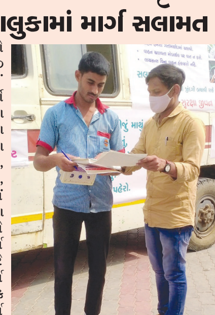
રથ પણ સાબરકાંઠાના તમામ તાલુકામાં જઈ માર્ગ સલામતી જાગૃતિ અભિયાનમાં ઉપયોગી માહિતી પહોંચાડી રહ્યો છે.

બાયડ (બ્યુરો ઓફિસ) તા.૨૦ ઉનાળો શરૂ થતાં માર્ગો લોહી તરસ્યા બન્યા છે. ત્યારે શ્રી ઉમિયા એજ્યુકેશન ટ્રસ્ટ દ્વારા સાબરકાંઠાના ઈડર, વડાલી, હિંમતનગર, પ્રાંતિજ તાલુકામાં માર્ગ સલામતી માટેના વિવિધ કાર્યક્રમો યોજાયા છે. માર્ગ સલામતી માટે પ્રતિષ્ઠા, માર્ગ સલામતીની પ્રાથમિક તાલીમ, માર્ગ સલામતી માટે સાહિત્યનું ફ્રી વિતરણ, માર્ગ સલામતી માટે શું કરી શકું...?? એ વિષય ઉપર નિબંધ અને ચિત્ર સ્પર્ધા યોજાઈ. ટ્રાફિક પોલીસ અને