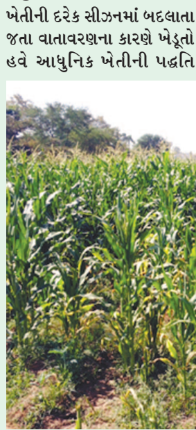
અપનાવે તે જરૂરી બન્યું છે. ખેતરોમાં રાત-દિવસ મહેનત કરી પરંપરાગત ખેતીમાં ઉત્પાદનમાં કોઈ ખાસ વધારો થતો ન હોવાથી

બાયડ (બ્યુરો ઓફિસ) તા.૨૦ સાબરકાંઠા, અરવલ્લી જિલ્લામાં અગાઉ યોજાયેલા કૃષિ મહોત્સવો બુમરેગ સાબિત થયા છે. ગ્લોબલ વોર્મિંગ અને બદલાતા વાતાવરણ તેમજ વરસાદની અનિશ્ચિતતા વચ્ચે ખેડૂતો અનુકૂળ પાકનું વાવેતર કરે તેવો આશય હતો પરંતુ કરોડો રૂપિયાના આંધણ પછી પણ જિલ્લામાં ન વાવેતર બદલાયું છે અને ન ઉત્પાદનમાં વધારો થયો હોવાથી કૃષિ મહોત્સવ બે અસર નિવડ્યા છે. જ્યારે જિલ્લાના જૂજ ખેડૂતો આપ મહેનતથી આધુનિક ખેતીમાં સફળતા મેળવી શક્યા છે. ખેડૂતોને આવક બમણી કરવા માટે કૃષિ મહોત્સવની સાથે સોઈલ હેલ્થ કાર્ડની યોજના પણ અમલમાં મૂકવામાં આવી હતી પરંતુ તે પણ ગુજરાતીઓ આરંભે સૂરા જેવી બની રહી છે.