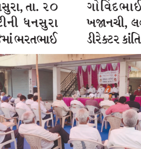
સોસાયટી ધ્વારા સારા કાર્યો કરવામાં આવે છે કોરોનામાં પણ માસ્ક વિતરણ જેવા કાર્યક્રમો કરાયા હતા