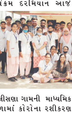
બાલીસણા ગામની માધ્યમિક શાળામાં કોરોના રશીકરણ અને ગ્રામજનો તેમજ બાલીસણા પ્રા.આ.કેન્દ્રના

પ્રાંતિજ તા. ૨૦ સાબરકાંઠા જિલ્લાના પ્રાંતિજ ખાતે આવેલ ચિત્રિણી નર્સિંગ કોલેજ ના તાલીમાર્થીઓ દ્વારા લોક જાગૃતિ કાર્યક્રમ યોજાયો હતો જેમા બાલીસણા ગામજનો ને કોરો ના રશીકરણ ની માહિતી આપવામા આવી હતી.