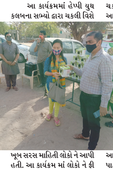
ખૂબ સરસ માહિતી લોકો ને આપી હતી. આ કાર્યક્રમ માં લોકો ને ફી