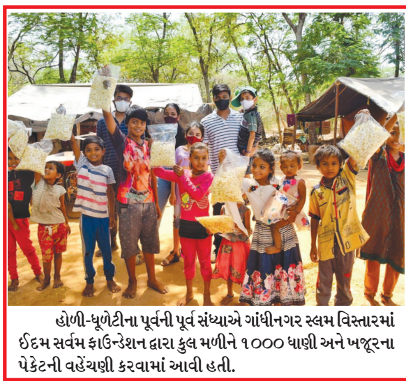
હોળી-પૂળેટીના પૂર્વની પૂર્વ સંધ્યાએ ગાંધીનગર સ્વમ વિસ્તારમાં ઈદમ સર્વમ ફાઉન્ડેશન દ્વારા કુલ મળીને ૧૦૦૦ ધાણી અને ખજૂરના પેકેટની વહેંચણી કરવામાં આવી હતી.