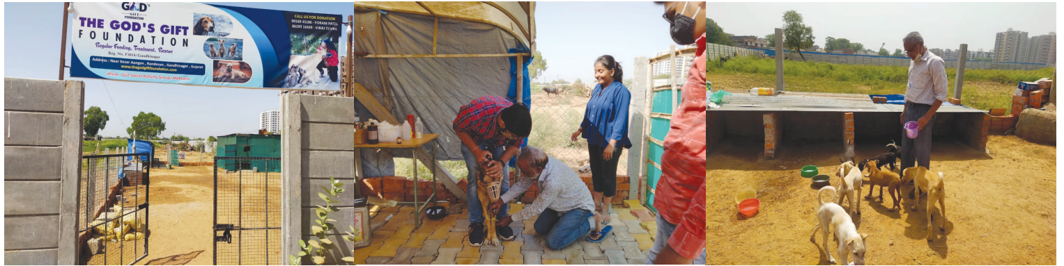
ગાંધીનગર, તા. ૨૭ ધ ગોડ્સ ગિફ્ટ ફાઉન્ડેશન દ્વારા અબોલ જીવ સેવા ના ભાગ રૂપે ફૂલ નહિ તો ફૂલ ની પાંખડી

સ્વરૂપ એક નાના શેલ્ટર હોમ ની રચના સ્વાગત અગાસિયાની સામે, સરગાસણ ખાતે કરવામાં આવી છે. જેમાં બીમાર અને