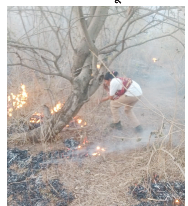
એકાએક માલપુરના જંગલ આકસ્મિક હોય તો પણ અનેક વિસ્તારમાં લાગેલી આગ સવાલ ઉભા કર્યાં છે.

બાયડ, તા. ૨૮ અરવલ્લી જિલ્લામાં અનેક જંગલ વિસ્તારમાં આગ ભભૂકી રહી છે છતાં વન વિભાગ ઘોર નિંદ્રામાં હોય તેવી સ્થિતિ છે. માલપુર તાલુકાના જેસીંગપુર અને સોનારીયાના જંગલ વિસ્તારમાં આગ લાગતા વન વિભાગના કર્મીઓ દોડતા થયા છે. ખરેખર આકસ્મિક આગ લાગી કે પછી વનિકરણ યોજનાનું ભોપાળું ઢાંકવા આગ લગાડી છે...!! તેની તપાસ થવી જરૂરી છે. બાયડના પૂર્વ ધારાસભ્ય ધવલસિંહ ઝાલાએ વન વિભાગના અનેક અધિકારીઓએ કોંગ્રેસના અગ્રણી સાથે મળી કેટલોક ભ્રષ્ટાચાર આદર્શનો ગત વર્ષે આક્ષેપ કરી તપાસની માંગ કરી હતી. જ્યારે આ વિસ્તારમાં લીલા વૃક્ષોનું ગેરકાયદે નિકંદન થઈ રહ્યું છે જેથી પર્યાવરણ પ્રેમી લોકોમાં પણ રોષ છે ત્યારે