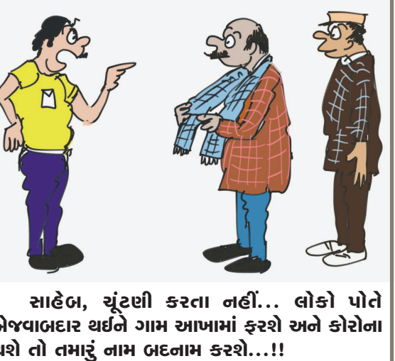
સાહેબ, ચૂંટણી કરતા નહીં... લોકો પોતે બેજવાબદાર થઈને ગામ આપામાં ફરશે અને કોરોના થશે તો તમારું નામ બદલાવ કરશે...!!