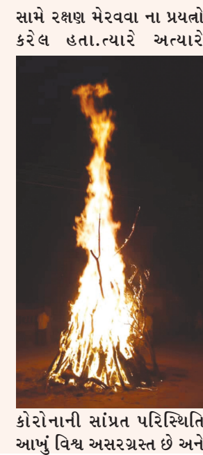
કોરોનાની સાંપ્રત પરિસ્થિતિ આખું વિશ્વ અસરગ્રસ્ત છે અને

સાથે સાથે હવામાં રહેલા વિષાણુ એટલે કે કોરોના વાયરસ કે સ્વાઈન ફ્લુ વાઈરસ જેવા ઝેરી જીવાણુઓનો પણ નાશ થાય અને અનેક જાતની બિમારીઓથી બચી શકાય. ગત વર્ષ થી વિશ્વમાં કોરોનાનો જીવલેણ વાઈરસ ના કારણે લોકો દેશી અને ઘરગથ્થું ઉપયોગો નો ઉપયોગ કરી કોરોના થી બચવાનો પ્રયાસ કરી રહ્યા છે, લોકો દેશી ઓષધીઓ નો કાયમી વપરાશ કરતા થાય છે, ભૂતકારમાં આવેલ જીવલેણ બીમારીઓ થી બચવા લોકો નવા નવા નુકસાનો કરતા હતા ત્યારે કોઈ કોઈ જગ્યાએ કપૂર ની ગોળીઓ પછા હોળીમાં હોમવામાં આવી હતી અને ચિકનગુનિયા જેવા રોગો ની સામે રક્ષણ મેરવવા ના પ્રયત્નો કરેલ હતા. ત્યારે અત્યારે