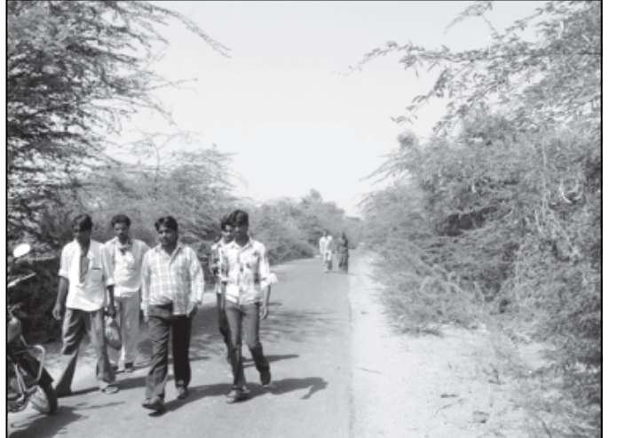
કાંકરેજ તાલુકાના રણવાડાથી શિહોરી જવાનો સીંગલ પહીવાળો રસ્તો મોટાભાગે તુટી ગયેલો છે અને રોડની બન્ને સાઈડોમાં ગોંડા બાળળોના ઝૂંડ લચીપડ્યા છે તેમજ સામસામે આવતા વાહનો પણ દેખાતા ન કોઈ મોટી જાનહાની ન થાય તેથી લાગતા વળગતા અધિકારીઓ જાતે તપાસ કરી બાવળોનું કટાંગ કરાવે અને રોડ પર પડેલા ગાબડા પૂરાવે તેવો જનમત છે. લોકોની લાગણી અને માગણી અધિકારીઓ સ્વીકારશે ખરા?