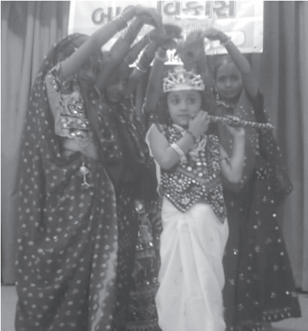
શ્રી સત્ય સાંઈ બાલ વિકાસ મંડળ દ્વારા રવિવારે સાંજે ફાર્મસી કોલેજ હોલ, સર્વ વિદ્યાલય કેળવણી મંડળ કેમ્પસ, સંકેટર-૨૩ ખાતે સાંસ્કૃતિક કાર્યક્રમનું આયોજન કરવામાં આવ્યું હતું. બાળકોએ સુંદર કાર્યક્રમો રજૂ કરીને શ્રોતાઓને દંગ કરી દીધા હતા.