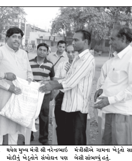
કૃષિ મહોત્સવ અંતર્ગત ગામમાં સાંજના ૭.૦૦ કલાકે શરૂ થયેલ મુખ્ય મંત્રી શ્રી નરેન્દ્રભાઈ મોદીનું ખેડૂતોને સંબોધન પણ બેસી સાંભળ્યું હતું.

રોજનું કેટલું દુધ ડેરીમાં ભરાય છે. તેમજ રાજ્ય સરકારના પશુપાલન ખાતા દ્વારા યોજાતા પશુ આરોગ્ય મેળાની કામગીરી અને કેટલા પશુઓનું રસીકરણ કરવામાં આવ્યું છે. જેવી વિગતો ગામના અગ્રણીઓ પાસેથી મેળવી હતી. મંત્રી શ્રી દિલીપભાઈ સંઘાણીએ ગામના ખેડૂતો સાથે ગામમાં વાવેતર કરવામાં આવતા વિવિધ પાકોની, ડ્રીપ ઈરીગેશનથી કેટલી જમીનમાં ખેતી થાય છે, બાગાવાત પાકોનું વાવેતર કેટલા ખેડૂતો કરે છે, અને રાજ્ય સરકારના કૃષિ મહોત્સવ અંગેના ખેડૂતોના નિભાવ સ્વયં મેળવ્યા હતા. તેમજ કૃષિ મહોત્સવ અને પશુપાલન અંગે પણ અન્ય જરૂરી ચર્ચા-વિમર્શ ખેડૂતો સાથે મંત્રીશ્રીએ કર્યા હતા.