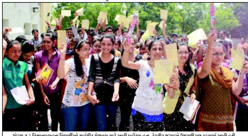
ધોરણ-૧૨ વિજ્ઞાનપ્રવાહના વિદ્યાર્થીઓ માર્કશીટ મેળવવા માટે આવી પહોંચ્યા હતા. કેટલીક જગ્યાએ ઉજવણી પણ કરવામાં આવી હતી.