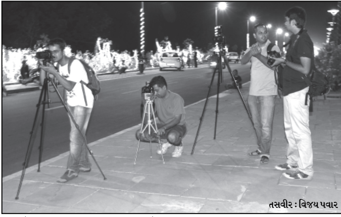
જામતા વેકેશનના માહોલની ફોટોગ્રાફી કરવાનું આયોજન

ગાંધીનગર, તા. ૧૮ બેરૂફ્ટ ફોટોવોકસ નામથી જાણીતા નગરના પહેલવહેલા ફોટોવોકસ પોતાની સાતમી ફોટોવોકસ આવૃત્તિકાલને એટલે કે સોમવાર, તા. ૨૧ મે ના રોજ યોજાઈ રહ્યા છે. પોતાની શરૂઆતથી જ આ ફોટોવોકસ 'દેખાતું છતાં અજાણ્યું' એ થીમ પર ફોટોગ્રાફી કરી રહ્યા છે. એ જ કમમાં તેમણે નગરજનો માટે ઉપયોગી વિષયોના ફોટોગ્રાફસ એકત્ર કરવાનો પણ નિર્ણય કર્યો છે, જે અંતર્ગત પબ્લિક ટ્રાન્સપોર્ટેશન, રાજ્ય સ્થાપના દિવસની ઉજવણી, અખબાર વિતરણની કામગીરી, નગરમાં ઉનાળા દરમ્યાન મહોરતી પ્રકૃતિ અને જૂના સચિવાલય બજારમીના બજારના ફોટોગ્રાફસ આ ફોટોવોકસ દ્વારા એકત્ર કરવામાં આવ્યા છે.