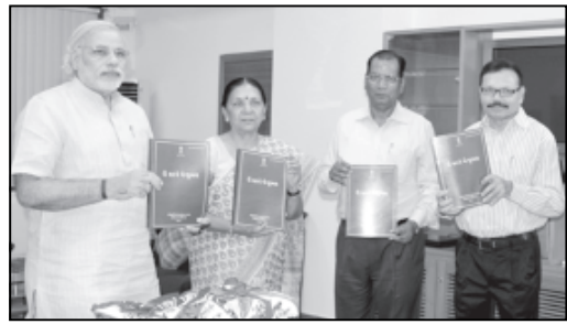
હાથ ધરવામાં આવેલ હતી અને આ રીતે કરવામાં આવતી જમીન મોજણીની કામગીરીની કેટલીક મર્યાદાઓ પણ હતી. જે તે સમયે આ રીતે કરવામાં આવતી માપણીના માપો કાળગ ઉપર ખેતરવાર નોંધવામાં આવતાં હતાં અને તે આધારે સર્વે નંબર, ક્ષેત્રફળ, ખેતરના કબજેદાર, ખેતરની વિવિધ લાક્ષણિકતા વિગેરે બાબતો ધ્યાને લઈને આકારબંધ તૈયાર કરવામાં આવતો હતો. ગામની જમીન ખેડવાણ, બિનખેડવાણ, પડતર, ખરાબા, ગૌચર, જાહેર હેતુ વગેરે -કારે વર્ગીકૃત

કરી ગામનું રેકર્ડ તૈયાર કરવામાં આવતું હતું. આમ, આ એક લાંબી-ક્રિયા કાળજીપૂર્વક હાથ ધરવામાં આવતી હતી. પરંતુ રેકનોલોજીની મર્યાદાને કારણે તૈયાર થતા રેકર્ડમાં ચોક્કસાઈનો અભાવ પણ વર્તાતો હતો. હવે અદ્યતન ટેકનોલોજીના સમયમાં રાજ્યની કિમ્ની જમીનોની ચોક્કસાઈપૂર્વકની માપણી થવી જોઈએ. ગુજરાત રાજ્યમાં અમલી ગુજરાત જમીન મહેસૂલ અધિનિયમની જોગવાઈઓ મુજબ તો આકારણી નવેસરથી ઠરાવવાના હેતુસર દર ત્રીસ વર્ષે જમીનોની પુનઃ મોજણી થવી જોઈએ, પરંતુ રાજ્યમાં બ્રિટીશ શાસન પછી જિલ્લાવાર વ્યાપક કામગીરી હાથ ધરાયેલ ન હતી. રાજ્ય સરકારે મૂળ સરવે પછી ખેતીની જમીન પર લેવાતા આકારમાં કોઈ વધારો કરેલ નથી અને હવે આ આકાર અથવા મહેસૂલમાંથી નફા થતી રકમ નગણ્ય થતાં સરકારે સને ૧૯૮૭થી ખેતીની જમીન પરથી મહેસૂલ વસૂલ કરવાનું મુલતવી રાખેલ છે.