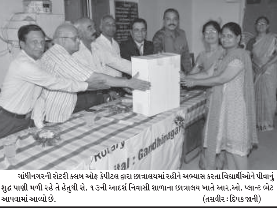
ગાંધીનગરની રોટરી ક્લબ ઓફ કેપીટલ દ્વારા છાત્રાલયમાં રહીને અભ્યાસ કરતા વિદ્યાર્થીઓને પીવાનું શુદ્ધ પાણી મળી રહે તે હેતુથી સે. ૧૩ની આદર્શ નિવાસી શાળાના છાત્રાલય ખાતે આર.ઓ. પ્લાન્ટ ભેટ આપવામાં આવ્યો છે.