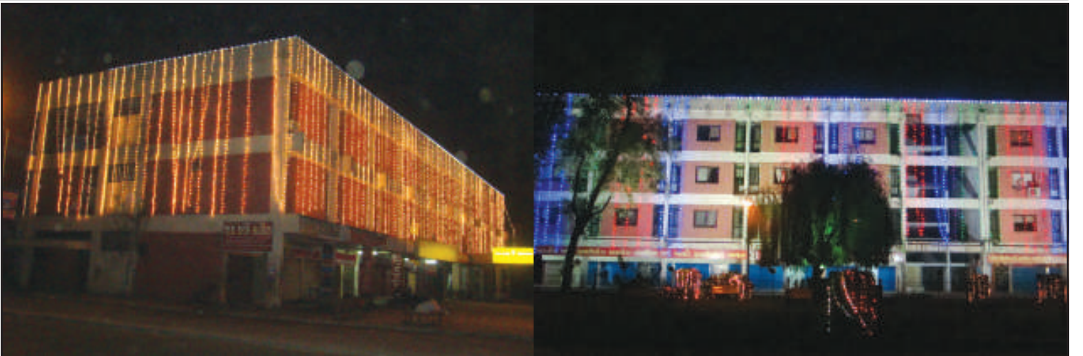
રોશનીનો જળહણાટ - ગુજરાતના સ્થાપના દિવસની સંધ્યાએ ગાંધીનગર જિલ્લાની સરકાર કચેરીઓ રોશનીથી સજાવાઈ હતી. ગૌરવ દિવસની સમીપમાં જળહણાટથી નયનરમ્ય બની હતી. જિલ્લા સેવાસદન, મહાનગર સેવાસદન, પાટનગર ભવન અને સહયોગ સંકુલ રોશનીથી શણગારાયા હતા...