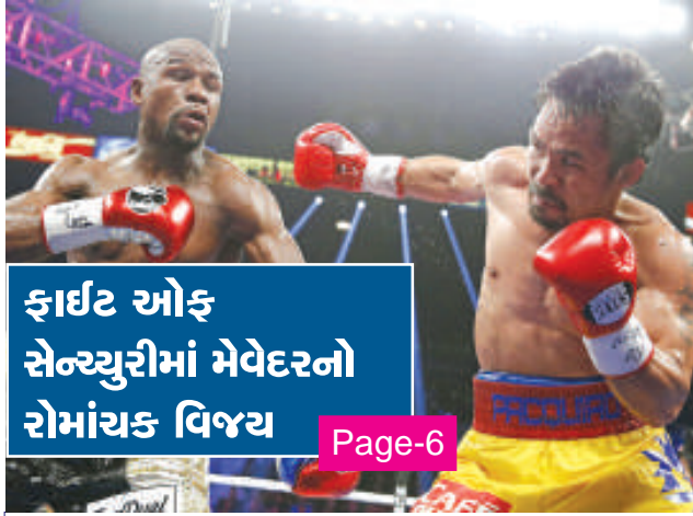
ફાઈટ ઓફ સેન્ટ્યુરીમાં મેવેદરનો રોમાંચક વિજય