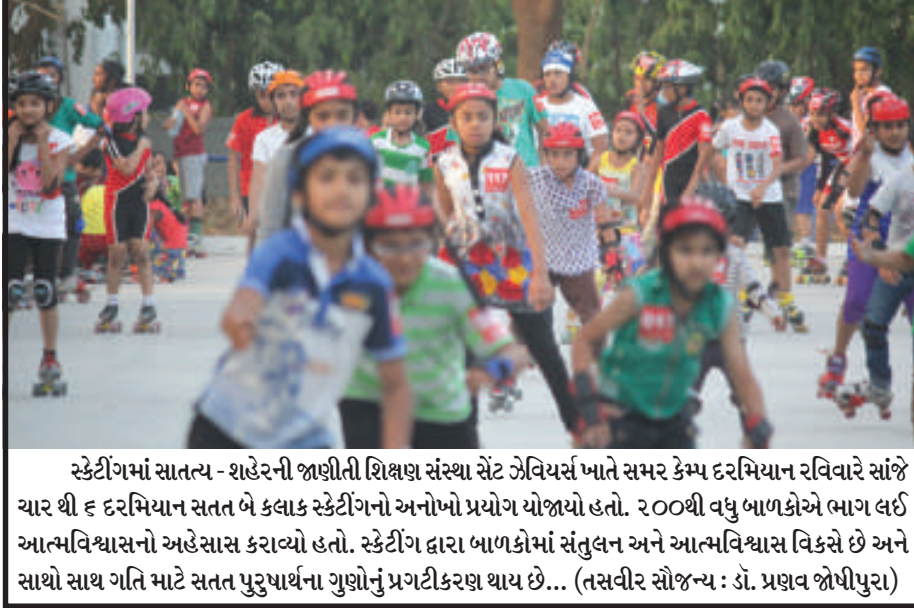
સ્કેટીંગમાં સાતત્ય - શહેરની જાણીતી શિક્ષણ સંસ્થા સેંટ ઝેવિયર્સ ખાતે સમર કેમ્પ દરમિયાન રવિવારે સાંજે ચાર થી ૬ દરમિયાન સતત બે કલાક સ્કેટીંગનો અનોખો પ્રયોગ યોજાયો હતો. ૨૦૦થી વધુ બાળકોએ ભાગ લઈ આત્મવિશ્વાસનો અહેસાસ કરાવ્યો હતો. સ્કેટીંગ દ્વારા બાળકોમાં સંતુલન અને આત્મવિશ્વાસ વિકસે છે અને સાથો સાથ ગતિ માટે સતત પુરુષાર્થના ગુણોનું પ્રગટીકરણ થાય છે...