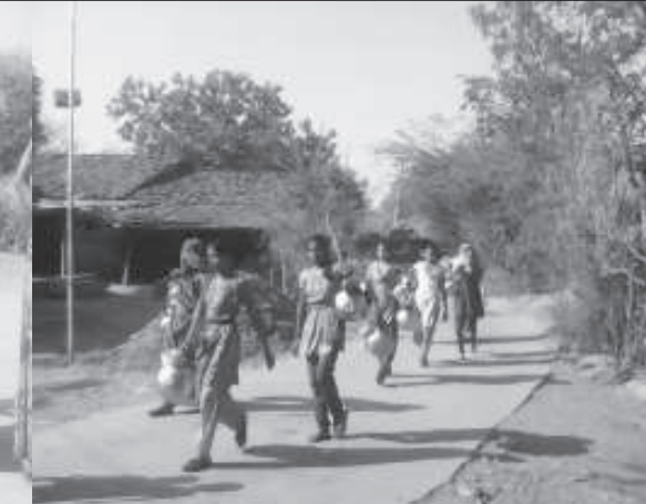
(તસવીર : જય અમીન, મોડાસા)

તળાવો સુકાભદ્ર છે. જ્યારે ગામડાઓમાં બોર-હેડપંપ યોગ્ય જાળવણીના અભાવે બંધ હાલતમાં હોવાથી ગામડાઓમાં પીવાના પાણીની સમસ્યા વિકટ બની ગઈ