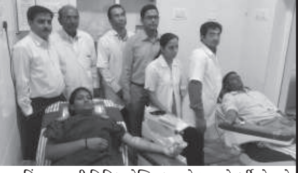
હિંમતનગરની સિવિલ હોસ્પિટલ ખાતે ગુરૂવારે દર્દીઓ માટે યોજાયેલા રક્તદાન કેમ્પમાં સિવિલ હોસ્પિટલના તબીબો, નર્સીસ અને સિવિલ હોસ્પિટલના સ્ટાફે ઉત્થાહત્વક રક્તદાન કર્યું હતું.

ડોલરની વાધેર નિકાસ ચાઈના દ્વારા છેલ્લા થોડાક સમયમાં કરવામાં આવી છે. આપણા મેન્યુફેક્ચરિંગ યુનિટ્સ ચાઈના દ્વારા વધારે પડતું એક્ષ્પોર્ટ કરવાના કારણે ખોખલા બનતા જાય છે. આપણા દેશના વડાપ્રધાન મેક ઈન ઈન્ડિયાની વાતો કરે છે પરંતુ પરિસ્થિતિ તેનાથી વિપરિત પેદા થઈ રહી છે. મેન્યુફેક્ચરિંગ યુનિટ્સ છેલ્લા એક વર્ષમાં નબળા પડતા ગયા છે તેનું એક કારણ એ પણ છે કે, આપણે ત્યાં ભગવાનની મૂર્તિથી લઈને મોબાઈલના ચાર્જર સુધી મેક ઈન ચાઈનાનો જ માલ વેચાઈ રહ્યો છે. વડાપ્રધાન મોદી