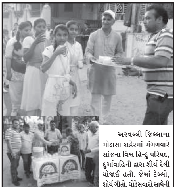
અરવલ્લી જિલ્લાના મોડાસા શહેરમાં મંગળવારે સાંજના વિશ્વ હિન્દુ પરિષદ, દુર્ગાવાહિની દ્વારા શોર્ય રેલી યોજાઈ હતી. જેમાં ટેબલ, શોર્ય ગીતો, ઘોડેસવારો સાથેની ભવ્ય રેલી કે.પી. છાત્રાલયથી મોડાસા ચાર રસ્તાથી બસ સ્ટેન્ડ થઈ સાઈ મંદિર કલ્યાણ ચોકથી ઋષિકેશ સોસાયટી વિસ્તારમાંથી પરત ફરી હતી ત્યારે મોડાસા લાયન્સ કલબ દ્વારા લાયન્સ કલબ સંચાલિત બહેરા મુંગા શાળા બહાર આ રેલીમાં જોડાયેલી બહેનોને ઉનાળાની ગરમીથી રાહત આપવા અને નારી સશક્તિકરણને પ્રોત્સાહન આપવા લાયન્સ કલબ ઓફ મોડાસા દ્વારા ઇલાશનું વિતરણ કરાયું હતું.