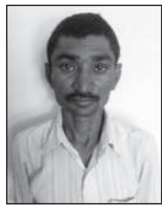
ગડદાપાટુનો માર મારી, પેટમાં લાતોનો મારો ચલાવતાં પડોશી