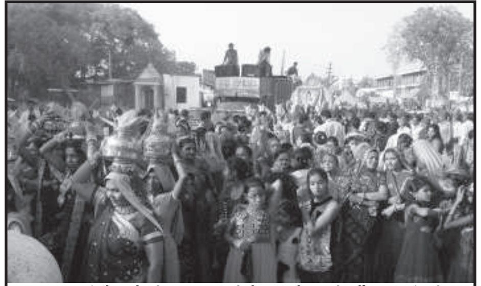
પાલનપુરમાં રહેતા મહેશ્વરી સમાજના અગ્રણીઓ દ્વારા 'મહેશ નવમી' પર્વે ભગવાન શંકરની ભવ્ય શોભાયાત્રાનું સૌ પ્રથમ આયોજન કરવામાં આવ્યું હતું. જેમાં મોટી સંખ્યામાં મહેશ્વરી પરિવારો જોડાયા હતા. આ શોભાયાત્રા નગરભરમાં ફરી હતી.