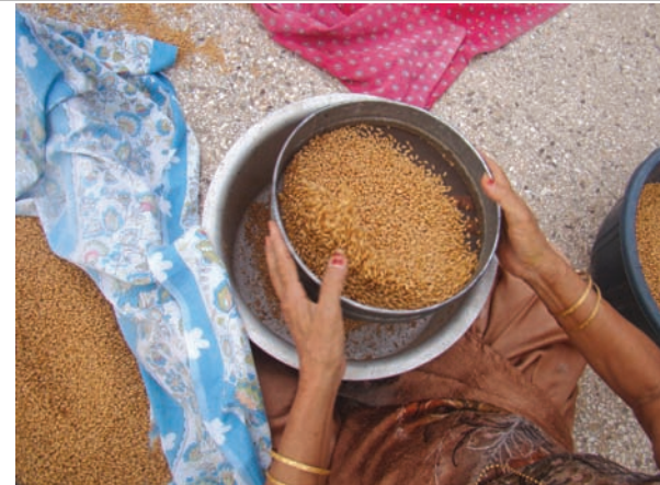
ઘઉંની સીઝન - ઘઉં ભરવાની મોસમમાં ઘરે ઘરે અત્યારે ઘઉંની સાફ સૂફીની કામગીરી પૂરજોશમાં ચાલી રહી છે...

બેબી'નું સ્કલ્પચર બનાવ્યું છે. 'અમૂલ બેબી' એ માર્કેટીંગ ક્ષેત્રે ખૂબ જ અગત્યનું પાત્ર ગણાય છે. કારણ કે તે અમૂલ બ્રાન્ડને વિશાળ પરિપ્રેક્ષ્યમાં વિસ્તારવામાં મુખ્ય જ સફળ સાબિત થયું છે અને આ કારણે તે અમૂલ બ્રાન્ડની ઓળખ સમાન બની જવા પામ્યું છે. હરિન ભટ્ટે આમ તો તેમની સ્કલ્પચર આર્ટ માટે વિવિધ માધ્યમો જેવા કે કલે, નેચરલ ફેબ્રિક, કોટન, વુડન વગેરેનો આધાર બનાવી બેજોડ મોડેલ્સ તૈયાર કરતા આવ્યા છે પરંતુ ગાંધીનગરમાં તેમણે વૈશ્વિક સ્તરની કોટન સ્કલ્પચરની આર્ટ ગેલેરી વિકસાવવાનું સ્વપ્ન જોયું છે. આ આર્ટ ગેલેરી તેઓ વૈશ્વિક કક્ષાની બનાવવા માંગે છે. જેમાં કોટન ફેબ્રિકના યુનિક માધ્યમ થકી અવનવા સ્કલ્પચર ડિસ્કલે કરાશે. તેઓએ પોતાના આ સ્વપ્નને સાકાર કરવાના મિશનના ભાગરૂપે જ હાલ આ 'અમૂલ બેબી'નું નિર્માણ કર્યું છે.