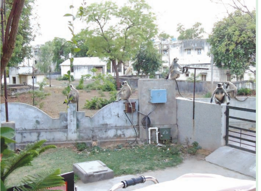
વાનરોની ટોળકીએ બંગ્લોઝના રહીશોને નિશાન બનાવી કરડતા બંગ્લોઝમાં રહેતા લોકોમાં ફફડાટ ફેલાયો છે.

લોવાથી મોટા પ્રમાણમાં વાંદરાઓ અહી વસવાટ કરે છે. અને વાનરો ઘણીવાર તોફાને ચઢતા બાઈક કારના અને ઘરના બારી-બારણાના કાય તોડી નાંખી આતંક મચાવતા રહે છે. પરંતુ તોફાને ચરેલા