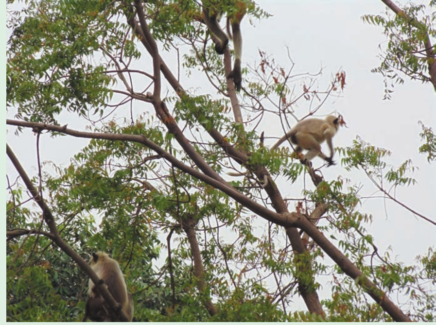
આતંક ફેલાયો છે. પંદર દિવસની આ વાનર ટોળકીએ તિરૂપતિ બંગ્લોઝ, આઈટીઆઈ વિસ્તાર અને બસસ્ટેન્ડમાં ૫ થી વધુ લોકોને

મોડાસા, તા. ૪ અરવલ્લી જિલ્લાના વડુમથક મોડાસા શહેરના માલપુર રોડ પર આવેલી તિરૂપતિ બંગ્લોઝમાં વાનર ટોળકીએ છેલ્લા એક મહિનાથી