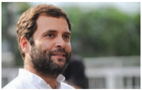
નવી દિલ્હી, તા. ૧૦

રાહુલ ગાંધીની પુકુચેરી, કેરળ અને તમિલનાડુની યાત્રા અંતે ૨૬