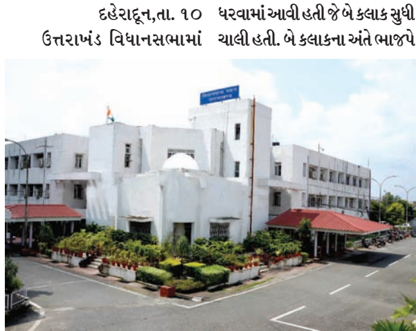
દહેરાદૂન, તા. ૧૦ ઉત્તરાખંડ વિધાનસભામાં

સુપ્રીમ કોર્ટની દેખરેખ હેઠળ બે કલાક વિશ્વાસમત પ્રક્રિયા ચાલી : સુપ્રીમ કોર્ટ દ્વારા વિશ્વાસમતના પરિણામ આજે સત્તાવારરીતે જાહેરાત કરાશે : હરિશ રાવતને ૩૩ અને ભાજપને ૨૮ મત મળ્યા