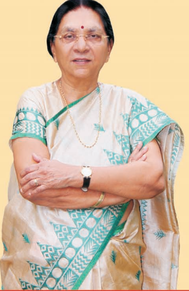
શ્રીમતી આનંદીબેન પટેલ મુખ્યમંત્રી, ગુજરાત રાજ્ય

સ્વામી વિવેકાનંદજીના “ઉઠો, જાગો અને ધ્યેયપ્રાપ્તિ સુધી થોભો નહિ” સૂત્રને સાર્થક બનાવીએ