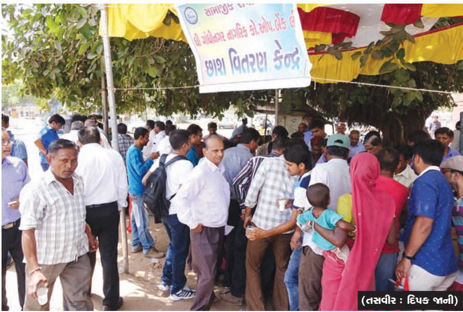
ગાંધીનગરના સેક્ટર-૧ ૬ માં આવેલી ધી ગાંધીનગર નાગરિક કો.ઓ.પ. બેંક લી. દ્વારા સામાજિક સેવા અર્થે કાળજીપૂર્ણ ગરમીમાં નાગરિકોને રાહત આપવા નિ:શુલ્ક છાશ વિતરણ કેન્દ્રની શરૂઆત કરવામાં આવી છે. જેમાં દરરોજ ૧૨૦ લિટરથી વધારે છાશ પીવડાવવામાં આવે છે.