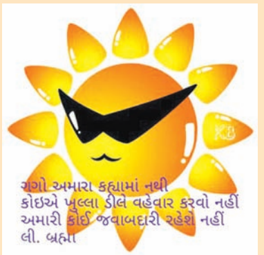
ગોઝો અમારા કલામાં નથી કોઈએ ખુલ્લા ડીલે વહેવાર કરવો નહીં અમારી કોઈ જવાબદારી રહેશે નહીં લી. બહા

ગાંધીનગર, તા. ૨૦ ગાંધીનગર શહેર સહિત રાજ્યભરમાં ભયંકર હિટવેવની અસર થઈ રહી છે. પરિણામે સંપૂર્ણ જનજીવન પ્રભાવિત બની રહ્યું છે. ત્યારે વોટસઅપ અને ફેસબુક જેવા સોશયલ મીડિયા પર ગરમી પર અવનવા જોકર રમુજ દુચકા અને કમેન્ટ પણ સતત 'હિટ' થઈ રહ્યા છે અને ગરમી અને તાપથી બચી ઘરમાં બેઠા બેઠા લોકો પોસ્ટો વાંચી મનોરંજન લઈ રહ્યા છે. શહેરમાં ગરમીને પગલે લોકો ત્રાહીમામ પોકારી ઉઠ્યા છે. સતત ગરમીનો પારો તેનો ઐતિહાસિક રેકોર્ડ તોડી રહ્યો છે. અગન દગ્ગાડતી ગરમીથી બચવા નાગરિકો ઠંડક આપતા વીજ ઉપકરણો પાસે જ બેસી રહેવાનું પસંદ કરે છે. ગરમી સતત વધતા આ ગરમીને લઈ ફેસબુક અને વોટ્સઅપ જેવા ગરમી સંબંધીત અવનવી રમુજ, જોક અને દુચકાનો મારો વધી રહ્યો છે અને લોકો ઘરમાં પુરાઈ એક બીજાને પોસ્ટો મોકલી મનોરંજન લઈ રહ્યા છે.