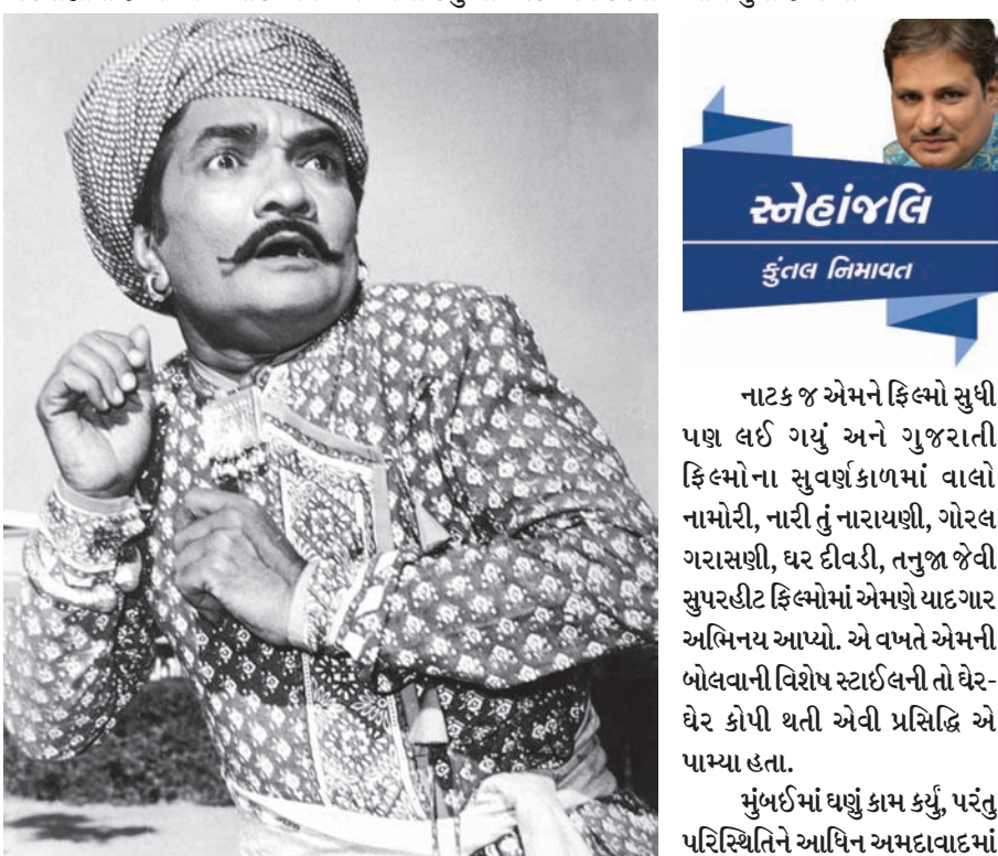
સ્નેહાંજલિ કુંતલ નિમાવત

ગાંધીનગર, તા. ૨૦ સેક્ટર-૨ સ્થિત શ્રી સ્વામિનારાયણ મંદિરમાં બિરાજમાન ધનસ્થામ મહારાજ, નરનારાયણ દેવ, રાધા-કૃષ્ણ દેવ આદિ દેવોને ફુલોના વાઘાથી સજજ કરવામાં આવશે. કાળજીપૂર્ણ ગરમીના દિવસોમાં ભગવાનને ઠંડકનો અહેસાસ થાય એવી ભક્ત સમુદાયની ભાવનાથી તા. ૨૧ મી મેના રોજ દેવોને ફુલોના વાઘા ધારણ કરાવવામાં આવશે. નરનારા ભાવિક ભક્તોને દર્શનનો લાભ લેવા મહંત સ્વામીએ જણાવ્યું છે.