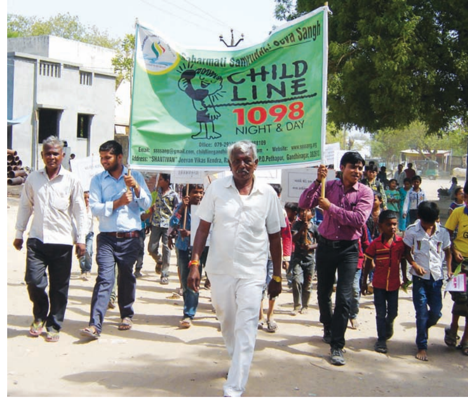
જિલ્લાના મોટી-આદરજ ગામ ખાતે ગાંધીનગર ચાઈલ્ડ લાઈન ૧૦૯૮ ચિલ્ડ્રન હેલ્પલાઈન અને જલ્લા બાળ સુરક્ષા એકમના સહયોગથી બાળલગ્ન નાબૂદી અને બાળમજૂરી તથા ફરજિયાત પ્રાથમિક શિક્ષણ પર રેલીનું આયોજન કરવામાં આવ્યું હતું. જેમાં ગામના લોકોએ ખુબજ ઉત્સાહથી ભાગ લીધો હતો અને પ્રોગ્રામને સફળ બનાવ્યો હતો. રેલીમાં ગામના બાળકો અને સાથે સાથે ગામની સ્ત્રીઓ પણ જોડાઈ હતી.