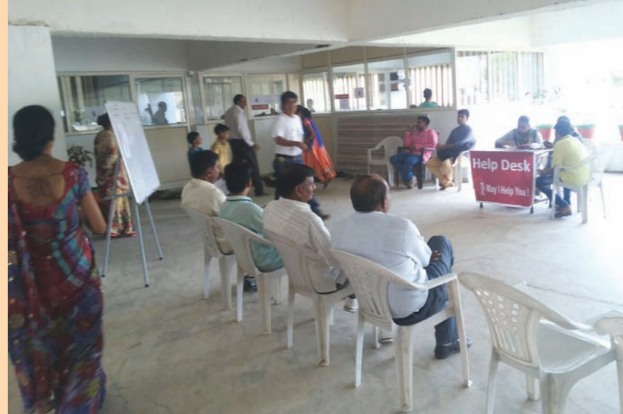
મેડિકલ-એન્જનિયરીંગના કરી રહ્યા છે. સારી સંસ્થાઓની કરવાનું શરૂ કર્યું છે.

ધો. ૧૦ના પરિણામ બાદ તુરંત જ માધ્યમિક શાળાઓમાં પ્રવેશની કાર્યવાહી શરૂ થઈ ચુકી છે. શહેરની નામાંકિત ગણાતી વિજ્ઞાન પ્રવાહની શાળાઓમાં સવારથી જ વાલીઓની ભીડ જોવા મળે છે. ગ્રાન્ટેડ ઉપરાંત નોન-ગ્રાન્ટેડ અને સેલ્ફ ફાઈનાન્સ