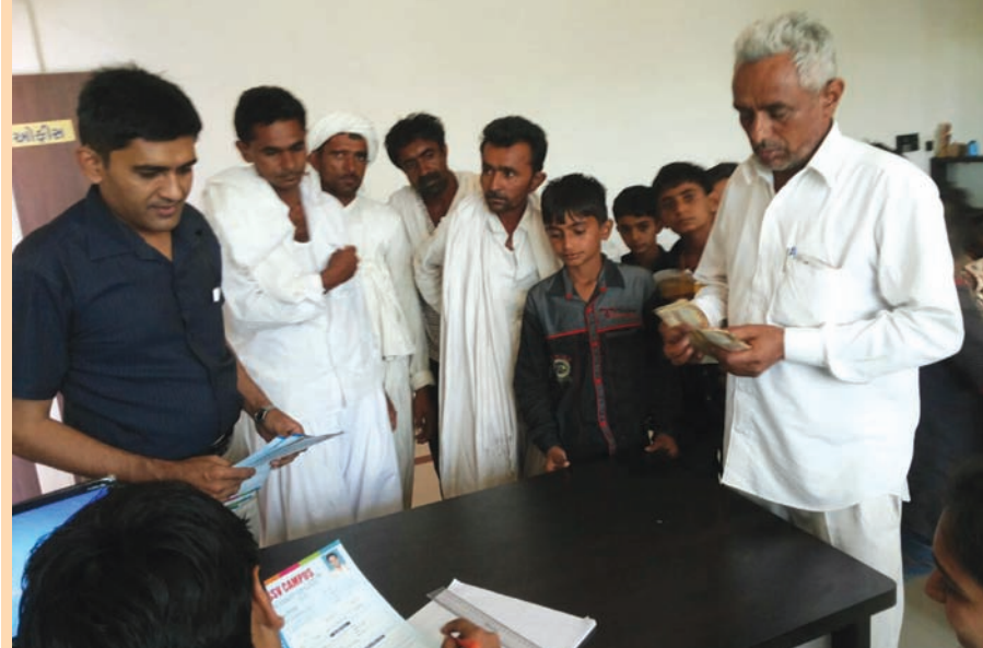
અપાવવા માટે વાલીઓની ટેન્શન વધી જાય છે. સૌ પ્રથમ તો સાથે વાલીઓ પણ દોડાદોડ કરે

ધો. ૧૨ વિજ્ઞાન પ્રવાહ બાદ ધો. ૧૦નું પરિણામ જાહેર થતા શાળા-કોલેજોમાં પ્રવેશ માટે વાલીઓ-વિદ્યાર્થીઓ શૈક્ષણિક સંસ્થાઓના ધક્કા ખાઈ રહ્યા છે