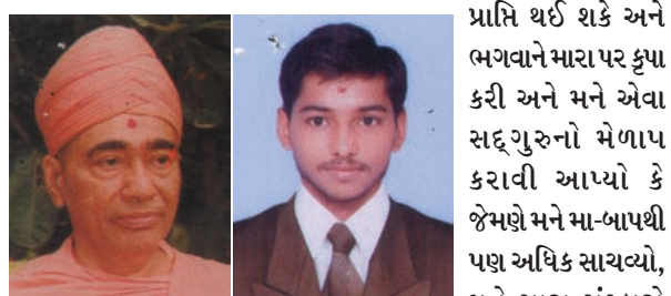
'મારા સદ્ભાવી સ્નેહી યુવાનો!