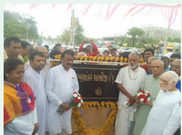
ત્યાં આપનો જન્મ થયો. બચપણથી નિપુણતા કેળવી શ્રીમદ્ જ ભગવતસેવામાં રસારૂચિ ભાગવતજીને જીવનનો આધાર બનાવી જીવન પર્યંત સંપર્કમાં

સંતસેવા માતા-પિતા શ્રી સંસ્કૃત શાસ્ત્રબ્યાસ સ્વીકારી વેદાન્ત વ્યાકરણ મીમાંસા જેવા વિષયોમાં આવેલા અનેક જીવોને ભગવન્મય અને ભાગવતમય બનાવ્યા. પ.પૂ. દાદાજી સર્વ વૈષ્ણવ સમાજના ક્ષિતિજ પર સૂર્ય સમાન ઉદયમાન હતા અને પોતાના જ્ઞાનદીપથી ભક્તિની ચિનગારીથી સેવાના પ્રકાશથી સર્વજગતને આલોકિત કર્યું. આ દિવ્ય પ્રકાશમાં વેદ-ભક્તિ-ગીતા-સેવા-સમર્પણ-સાધુતા-સમરસતા-વાત્સલ્ય-સ્નેહ-તેમની કિરણો પ્રસ્ફુટિત થતી હતી. તેઓ આ યુગના ભીષ્મ પિતામહ સમા હતા, જેમણે સમગ્ર જીવન સર્વ લોકોની પીડા દુઃખ-દર્દના શૂલભાણથી પોતાની શરીરને છલણી કરી દીધી. તેઓ શ્રીકૃષ્ણ અને શ્રી વલ્લભના અનન્ય ઉપાસક હતા.