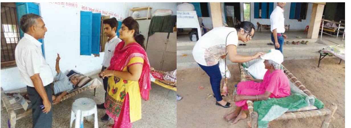
ક્રિએટિવ ક્લબ ઓફ ગાંધીનગર દ્વારા રાહેલબા વૃદ્ધાશ્રમ, મગોડી ખાતે કાળજાળ ગરમીથી રાહત માટે ટોપી અને કેરીની પેટીનું વિતરણ કરવામાં આવ્યું હતું. ક્રિએટિવ ક્લબના સભ્યોએ વૃદ્ધો સાથે સમગ્ર દિવસ ખુબ આનંદથી પસાર કર્યો હતો.