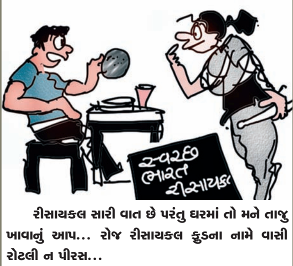
રીસાયકલ સારી વાત છે પરંતુ ઘરમાં તો મને તાજુ ખાવાનું આપ... રોજ રીસાયકલ કુડના નામે વાસી રોટલી ન ખોરસ...