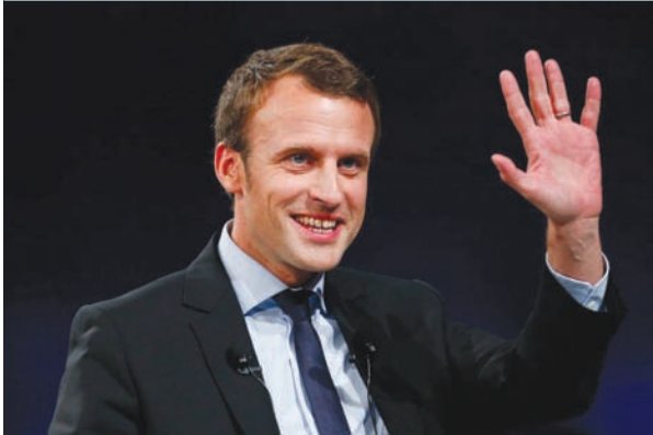
પેરિસ, તા. ૮

નજીકના હરિફ મેરીન લ પેનને હાર આપી : મેકો ૬૪ ટકા મતોની સાથે વિજેતા થયા : ફ્રાન્સના લાંબા ઇતિહાસમાં હવે એક નવા પ્રકરણની જ શરૂઆત : મેકો