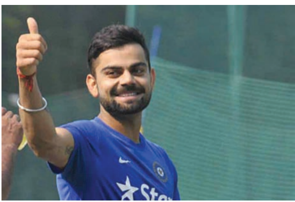
● અનુસંધાન પાન-૭ પર

નવી દિલ્હી, તા. ૮ જેની ઉત્સુકતાપૂર્વક રાહ જોવામાં આવી રહી હતી તે ચેમ્પિયન્સ ટ્રોફી માટે ટીમ ઈન્ડિયાની આજે જાહેરાત કરવામાં આવી હતી. ટીમ ઈન્ડિયામાં રોહિત શર્મા, આર.અશ્વિન, મોહમ્મદ સામી અને યુવરાજસિંહની વાપસી થઈ છે. ચેમ્પિયન્સ ટ્રોફીમાં સંપૂર્ણ તાકાત સાથે મેદાનમાં ઉતરવાનો નિર્ણય ભારતીય ટીમ દ્વારા કરવામાં આવ્યો છે. ચેમ્પિયન્સ ટ્રોફી માટે ટીમની પસંદગી કરવામાં આવ્યા બાદ આ ટ્રોફીમાં ભારતીય ટીમ રમશે કે કેમ તે અંગે ચાલી રહેલી અટકળોનો અંત આવી ગયો છે. ટીમ ઈન્ડિયામાં ફરી એકવાર યુવરાજને તક મળી છે. રોહિત શર્મા અને શિખર ધવનની પણ વાપસી થઈ છે. ટીમમાં આઈપીએલમાં શાનદાર પ્રદર્શન કરનાર મનિષ પાંડે અને હાર્દિક પંડ્યાનો પણ સમાવેશ કરવામાં આવ્યો છે. ટીમમાં પ્રદર્શનની સાથે અનુભવને પણ ધ્યાનમાં લેવાનો નિર્ણય કરાયો છે. બીસીસીઆઈએ પત્રકાર પરિષદ યોજીને ટીમની જાહેરાત કરી હતી. બીસીસીઆઈ તરફથી જાહેરાત કરવામાં આવેલા નિવેદનમાં કહેવામાં આવ્યું છે કે ૫૦ ઓવરની મેચમાં અનુભવ અને ઈંગ્લેન્ડની પરિસ્થિતિને ધ્યાનમાં લઈને ટીમની પસંદગી કરવામાં