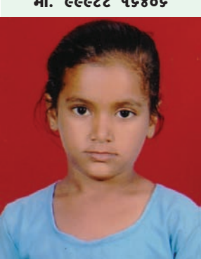
મો. ૯૯૯૮૮ ૧૬૪૦૬