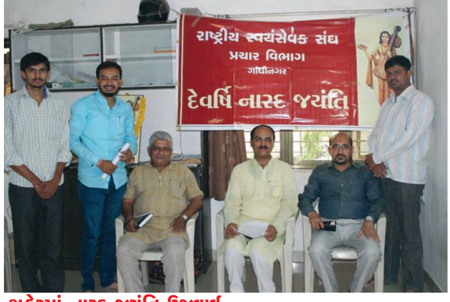
શહેરમાં નારદ જયંતિ ઉજવાઈ

ગાંધીનગરના રાષ્ટ્રીય સ્વયંસેવક સંઘના પ્રચાર વિભાગ દ્વારા આજે સે. ૨૩માં કાર્યાલય ખાતે દેવર્ષિ નારદ જયંતિ નિમિત્તે એક સેમિનારનું આયોજન કરવામાં આવ્યું હતું. આ સેમિનારમાં શહેરના પત્રકારોને આઘ પત્રકાર નારદનુનિના કાર્યથી વાકેફ કરી પત્રકારત્વ ક્ષેત્રે તેમના આદર્શ-મૂલ્યોના મહત્વને સમજાવવામાં આવ્યું હતું.